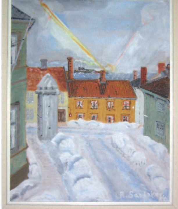
Vinter på Ila i Trondheim. Munholmen i bakgrunnen.