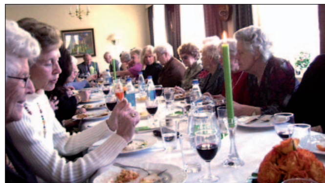
Damene i Drammen.