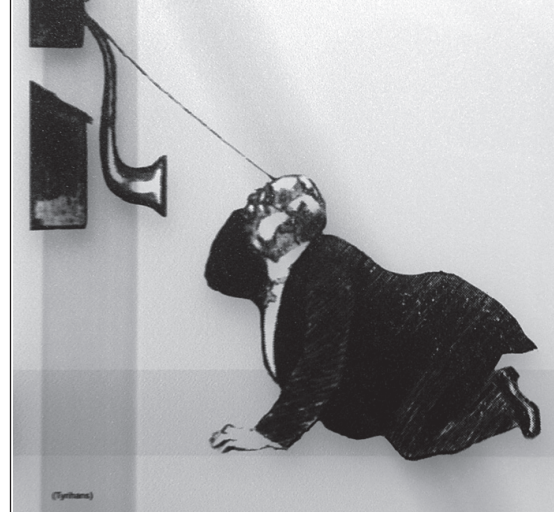
Første utenlandssamtale med Majesteten i Stockholm.

Forholdet var nemlig at i Telegrafvesenet var telegrafstasjonen i hovedstaden slett ikke klar til å ta seg av telefonekspedisjonen. Rikslinja var derfor etter avtale mellom Telegrafvesenet og telefonselskapet ført fram til og ble ekspedert