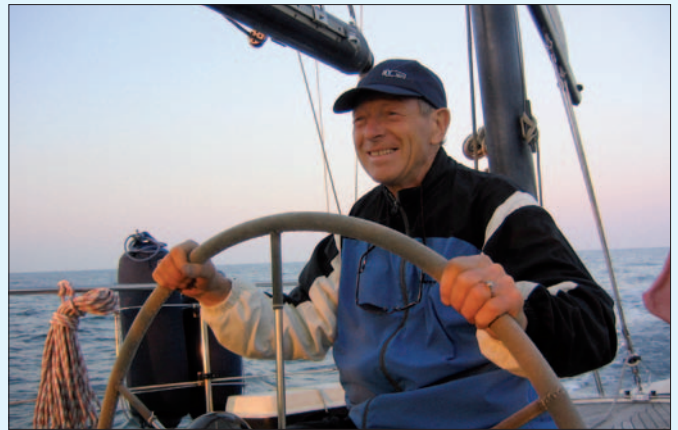
Ny redaktør ved roret

Som dere forstår har jeg planer om å fortsette linjen med å lage et blad med humor og alvor. Bladet skal speile lokalforeningene og medlemmene. Litt politikk og kultur må vi ha som krydder. Jeg håper på person-