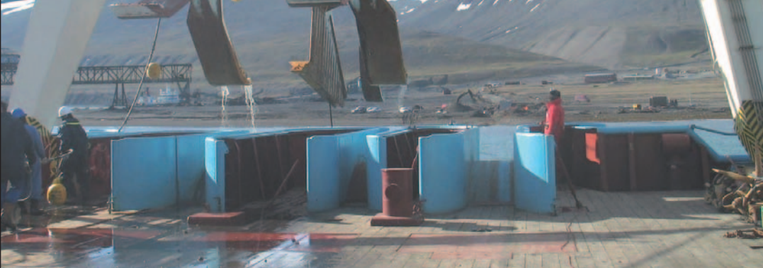
Kabelskipet på Svalbard