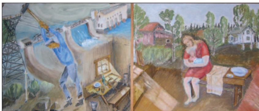
Mor var mor!