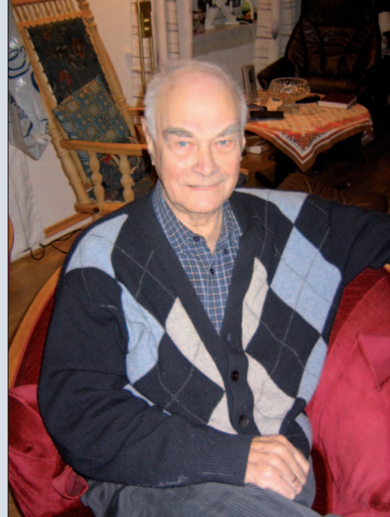
Det var ei fin tid i Televerket.