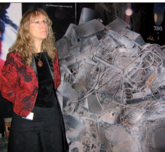
Antikk elektronikk med spindelvev

Telepensionistene utgjør en betydelig ressurs med sine kunnskaper. Museet vil derfor gjennomføre en intervjurunde av gamle televerkere for å få fram sider av den hverdagslige telehistorien som er viktig å bevare for ettertiden.