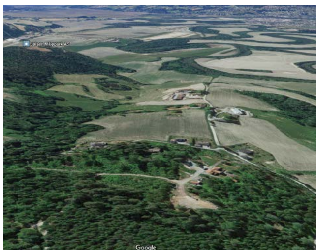
Her var gravhaugene synlige fra lang avstand og viste hvor maktssenteret var. Nå er det igjengrodd og lite påaktet og glemt. Distriktets eldste kirkeruin ligger midt i bildet. Et viktig element da pilegrimmene kom.

Skedsmo Historielag har brukt koronatiden til nennsom rydding og åpning av en del av gravfeltet. Dette etter avtale med en velvillig grunneier. Området har også flere «bygdeboger». Det pågår en diskusjon i fagmiljøet om det er «borger» etter vår tenkemåte.