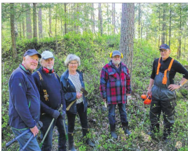
FRAM I LYSET: Med kvistsaks, motorsager og økser har styret i Skedsmo Historielag tatt fatt på skjotselen av Asak jernaldergravfelt.