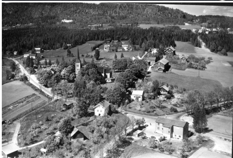
Mot Bryn kirke og områdene som først ble utbygget.