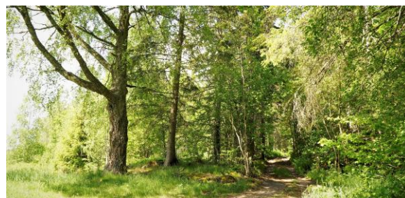
Få gjengrodd stier rundt Rykkinn, her er det mange som bruker turmulighetene.

Første delen av turen egner seg som sykkelstur. Det er dårlig med parkering for bil. Turen kan kombineres med en tur via Solefjellstua og ned ved Markebekk til fots. Ta med niste og ta hensyn til husdyr på beite.