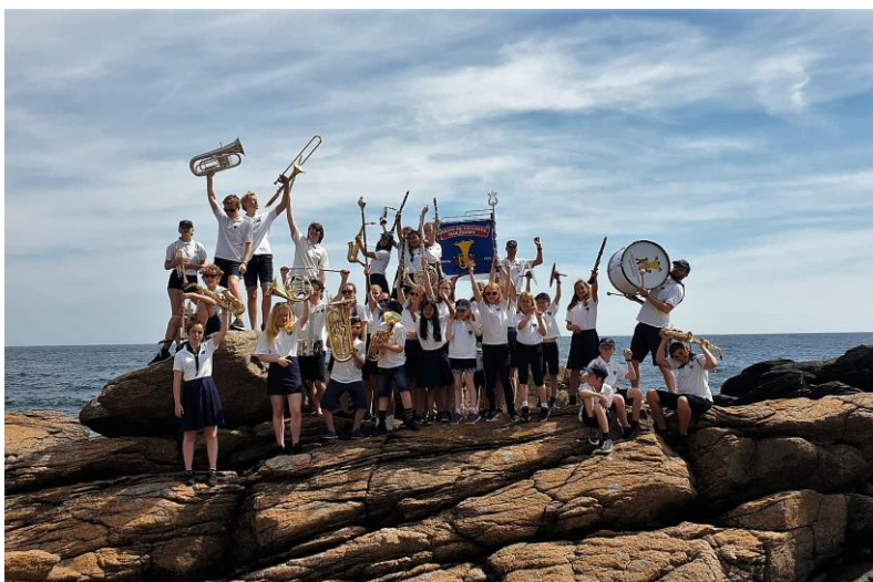
Bilder fra fjorårets tur til korpsfestivalen på Bornholm.

Om korpsene er heldige kan de få noe av sine tapte inntekter kompensert gjennom kommende støtteordning, men det dekker nok ikke opp for loppemarkedet og andre inntektsskapende aktiviteter. Og avkortning blir det også.