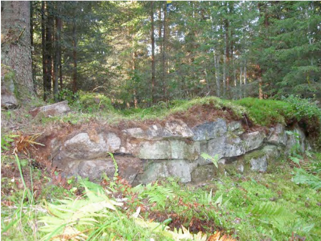
Hustuftene i Øvre Bekken i september 2014.

Og deri deilig Roser er, Som lugte liflig en og hver, Som trøster mig og gjør mig fro Og styrke mig i Haab og Tro.