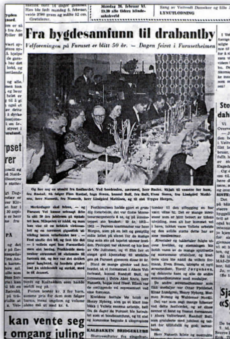
FAKSMILE: Akers Avis Groruddalen var med da Furuset Vel feiret 50 år i 1962 (fra avisens arkiv, 23.2.1962).