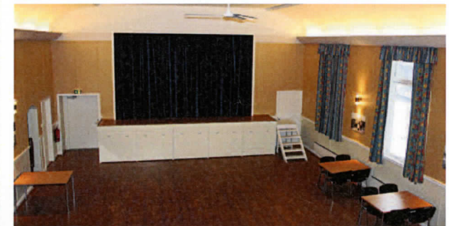
FRA MASKINROMMET: Fra rommet til kinomaskinisten og hans fremviser får man et godt overblikk over salen.