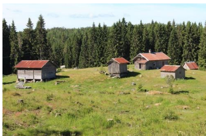
Skogfinneplassen Mikkelerud.

Riksantikvaren har tildelt Nittedal, Rakkestad og Ringerike 100 000 kr i tilskudd til arbeid med kulturminneplaner. I tillegg har Nittedal og Frogn fått 75 000 kr hver fra Akershus' tilskuddsordning for kulturminneplaner. Kulturminneplaner er et viktig redskap for kommunene i arbeidet med å kartlegge og forvalte kulturminner. Les om dette hos Riksantikvaren: https://www.riksantikvaren.no/kik/