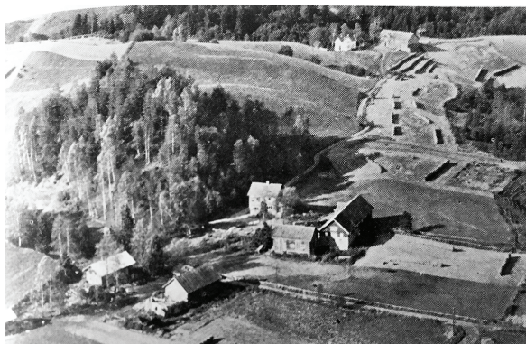
Flyfoto av Blånet (til venstre), Enger og Leirenga. Bak Blånet og Enger ser vi Høghaugen, en stor sandhaug som prestene på 1800-tallet brukte som lystlund. Foto fra Gjerdrum bygdebok, del 1.

kjøkkengulvet om eftan, da var a ferdig til jul. Da var potetene skrelt, surkålen i koken og ribba i ovnen, og når det begynte å lukte ribbe og surkål ute, var spenningen til å ta og føle på. Da måtte vi se å komme oss inn og få stelt og pynta oss, for da var det ikke lenge før kirkeklokkene ringte jula inn. Endelig var det julekvelden, og vi var så spente. For under jule-treet lå det to store pak-