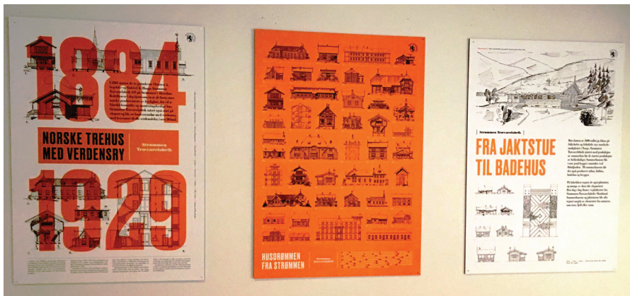
Eksempler på Riksantikvarens postere om Strømmen Trævarefabrik