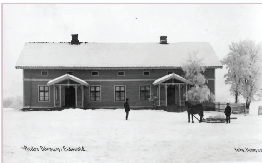
Vinterstemning i Eidsvoll.