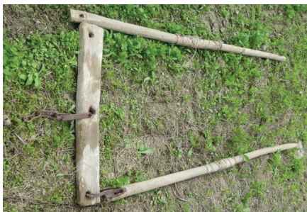
Figur 2 - Skokle til dra redskap