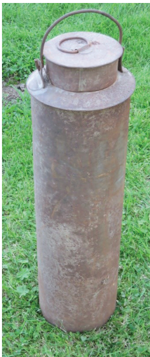
Figur 5 - Flotespann på 4 liter med fals til å sette ned i firkantet melkespann. Begge ble fraktet med tog til Kristiania.