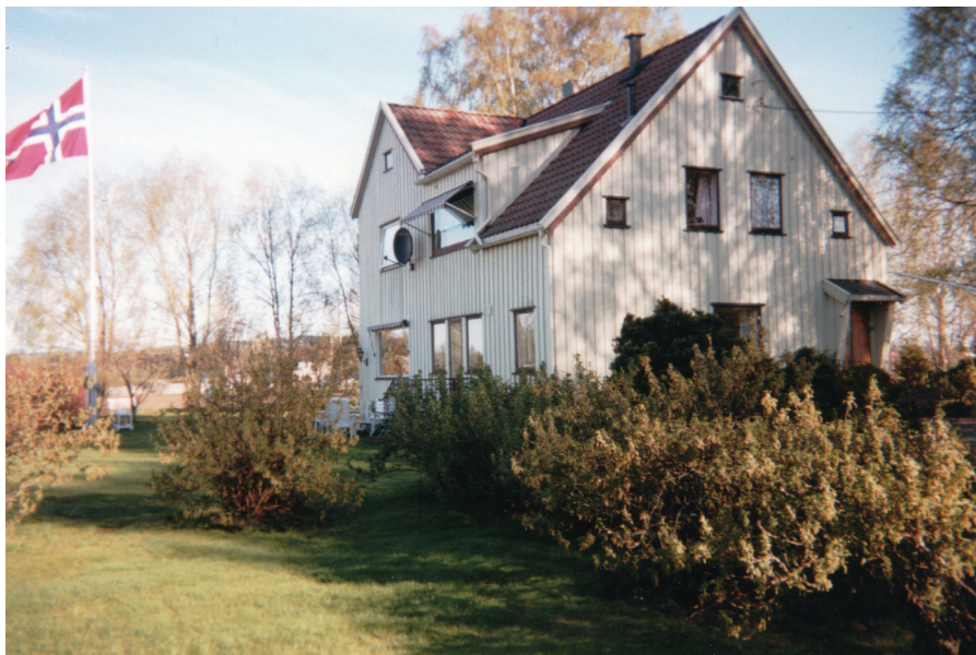
Marienlyst, Leirsund 1999