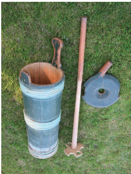
Figur 6 - Stavkjerne med stav og lokk fra Søgarn

Bjerke i 1865. Eiendom ga stemmerett. Fortsatt holdt de fleste ei ku, men inntekter kom til huset i bytte mot arbeid. Jordbrukskulturen overlevde middelalderen og opplysningstida, men på 1800-tallet ble mjølkekulturen som var båret og utført av kvinnene utfordret og fortrent. Kvinnene tapte kampen om føret til kuene mot mannens hest, og stellet av dyra tapte mot barn og gamle som krevde stell inne. Det hjalp lite at Akershus Amts Landhuusholdnings Selskap i 1853 utdannet omreisende lærerinner i ysting. Kari Syversdatter underviste i ysting på Romerike i 1854 og resultatet ble 350 faste oster fra 76 gårder i løpet av året. Det er ikke spor etter gårdsysterier på Romerike, så det var ikke marked for ostene som nok var av ujevn kvalitet. Prisen på mjølk var høy i Kristiania og folka på gårdene mislikte ystekonkurransen om mjølka, så ysting for salg ble det ikke mer av. Ryktet om sveitsernes oster og kustell gikk på bygda, men det ble med omlegging av kustellet.