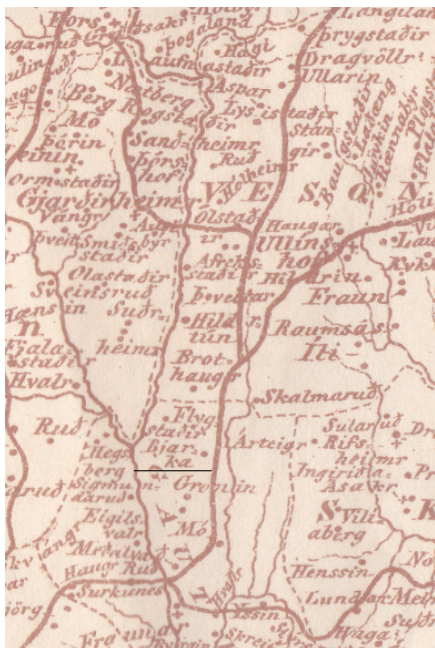
Figur 1 Kartutsnitt fra 1840 tegnet av G. Munthe. Bjarke midt i angir Bjerke.

helt i stavkjerna, skvett for skvett. Et hardt arbeid sto for tur med å dra staven opp og ned til det ble smør. Sur mjølk kunne holde seg lenge og ble varmet til kald grøt. De som hadde nok mjølk og hadde kar og kunnskap ystet pultost. Ystedagen startet tidlig og alle ystekar godt reingjort. Den store kobberkjelen ble satt i grua og finhogd bakstevet lå klar til fyring. Passe og jevn varme under gryta ga god ost. Sur skummamjølke i kjelen skulle ikke bli for varm (40-50 °C), da ble osten tørr og seig. Kjelen ble løftet av varmen og den fikk stå i fred ei stund til ostestoffet løp sammen. Søt skummamjølke ble varmet til 37 °C og tilsatt ei skje løpe før osten løp sammen. Et klede ble lagt i ystekaret og mysa silt ut. Surosten sto i ystekaret noen timer og ble vasket i vann og tilsatt salt og karve til pultost. Det