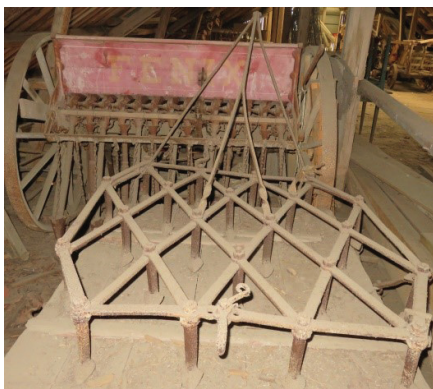
Figur 3 - Labbeharv bak nyere såmaskin