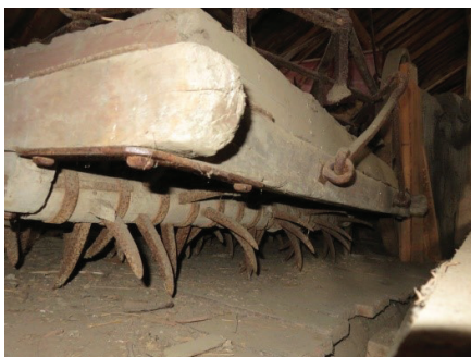
Figur 4 - Valseharv