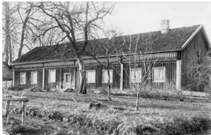
Mork gård.