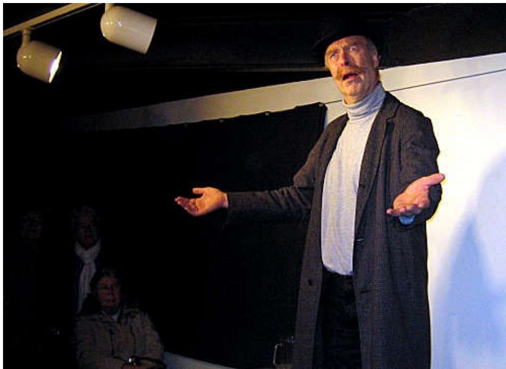
Fra forestillingen "En akevisit"

Avreise kl. 0900 fra Lillestrøm stasjon med en sving innom Skedsmokorset før vi kjører direkte til Domkirkeodden Der begynner vi med nystekt svele med rørte bær og kaffe på Hamarstua Spiseri før vi får en middelalderomvisning på Domkirkeodden. Deretter setter vi kursen mot Løten hvor vi får en omvisning på Løiten Brenderi.