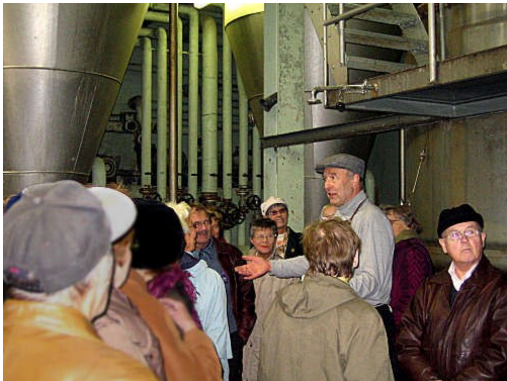
Fra forestillingen "En akevisit"