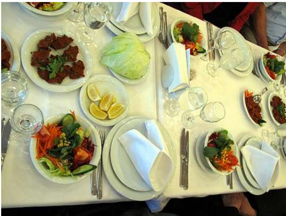
Det mistenkte spisestedet.