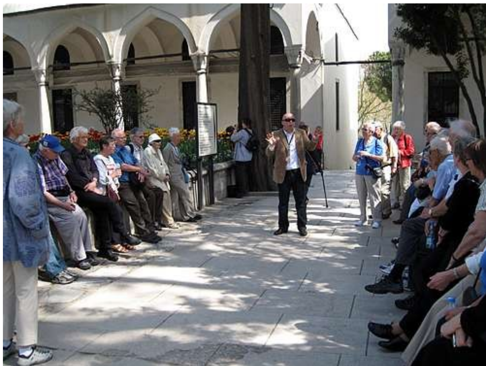
Vår guide forteller om Topkapipalasset.