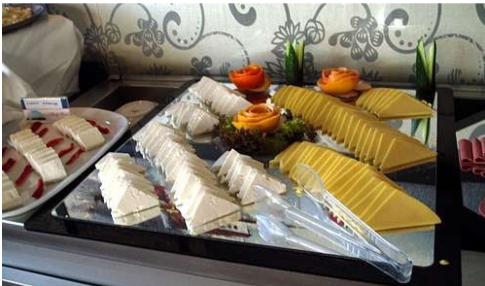
Fra hotellets frokostsal.