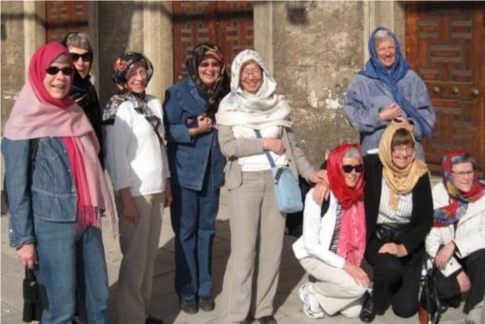
Noen av våre kvinnelige reisedeltakere.