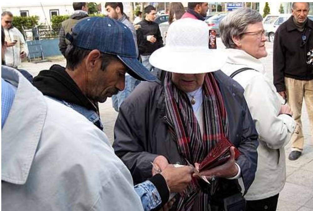
Gatesalg må prøves.