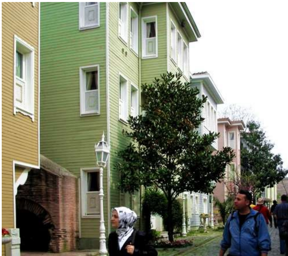
Fra en av Istanbuls gater.