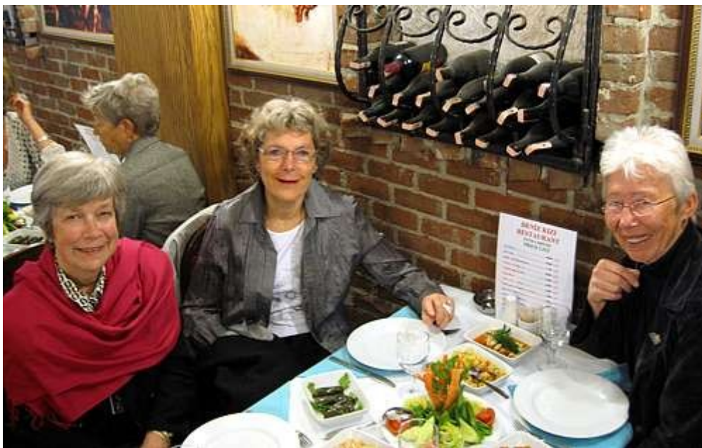
Reisekomiteen hadde innimellom tid til å spise.