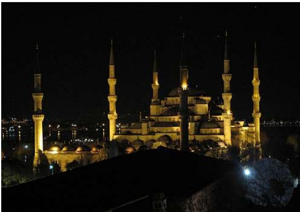
Den blå moske sett fra terrassen på hotellet vi bodde på - natt