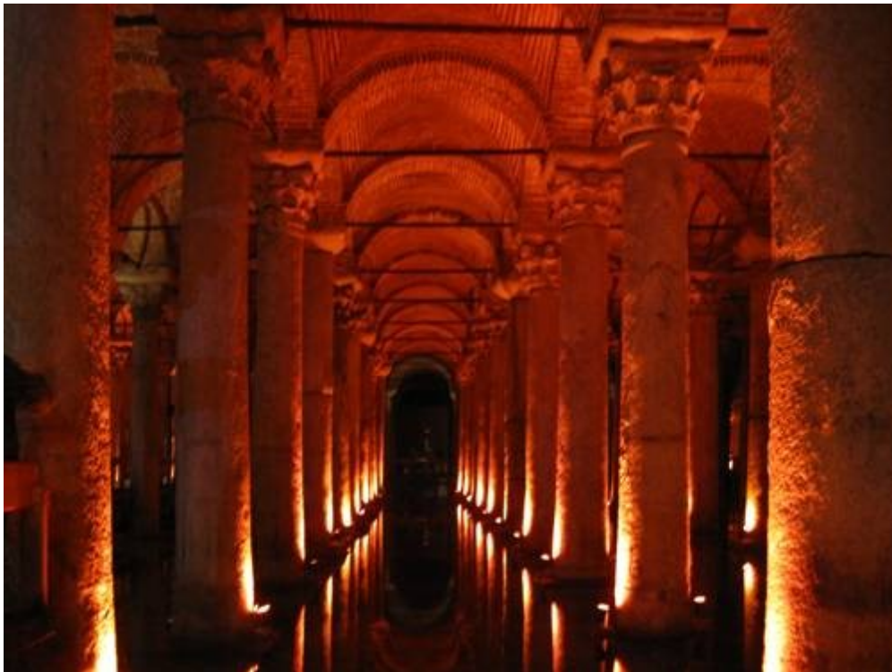
Underjordisk cisterne fra ca 300 e.Kr. Viktig for å sikre vannforsyningen i tilfelle beleiring.