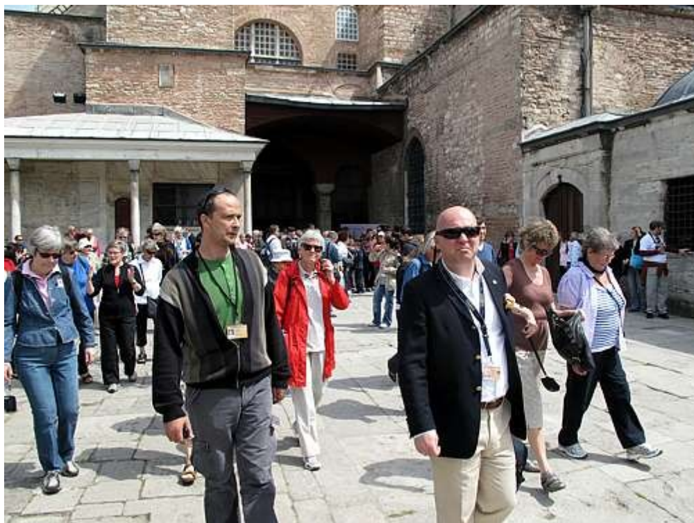
Utenfor Hagia Sofia. Våre to guider foran.