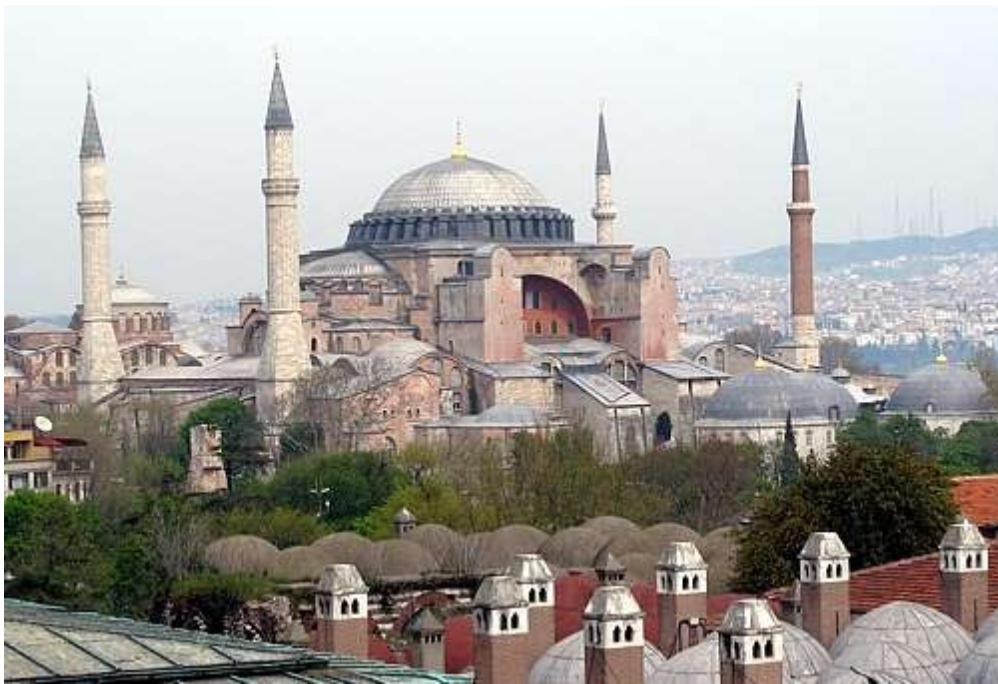
Hagia Sofia, innviet av keiser Justinian i 537 e.Kr.