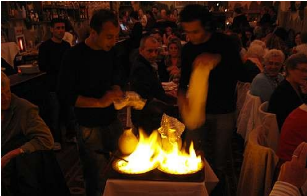
Eksotisk rett tilberedes