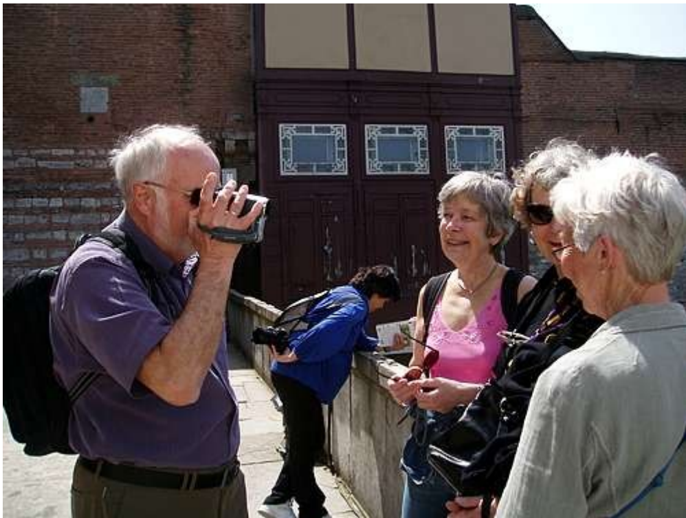
Vår medfølgende reporter filmer reisekomiteen