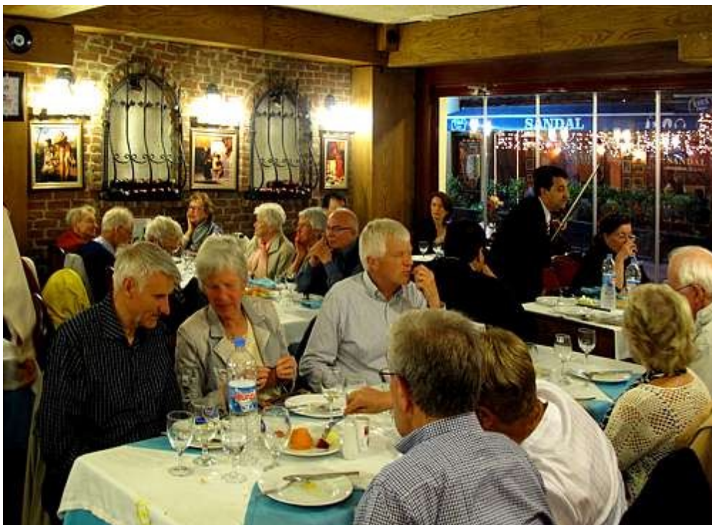
Fra ett av de mange restaurantbesøk