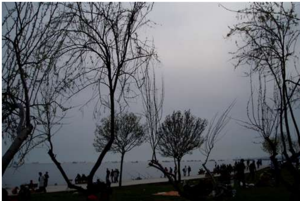
Stemning på Prinseøyene