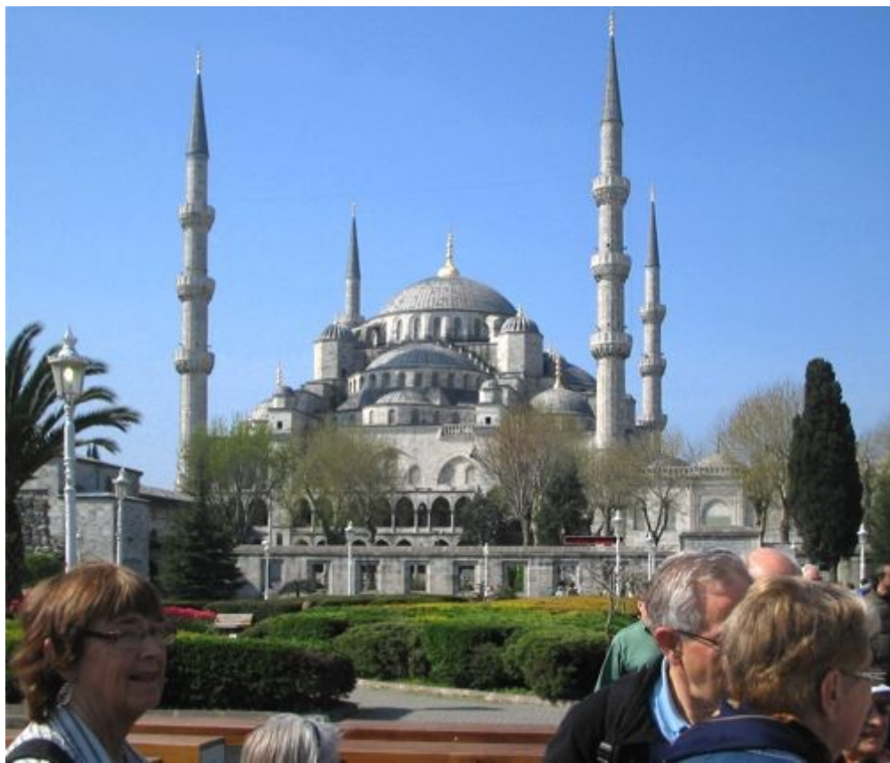
Hagia Sofia fra en annen vinkel.