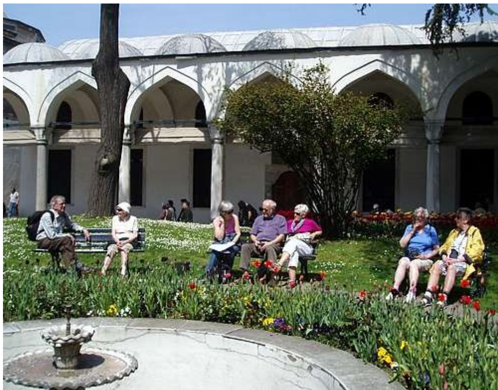
En hvil i parken i Topkapipalasset