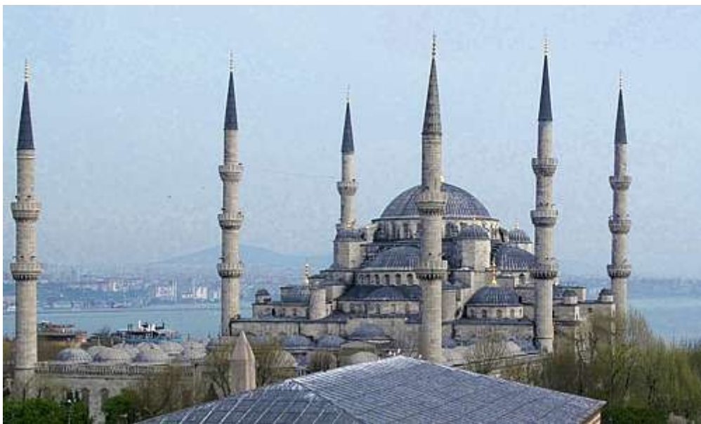
Den blå moske sett fra terrassen på hotellet vi bodde på - dag