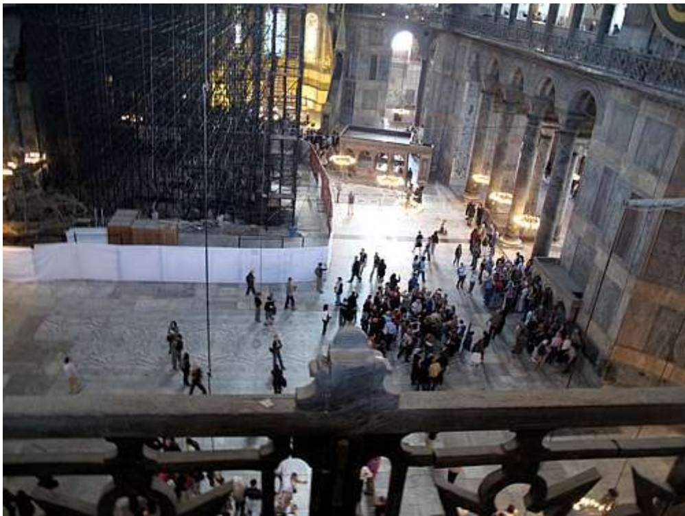
Inne i Hagia Sofia.