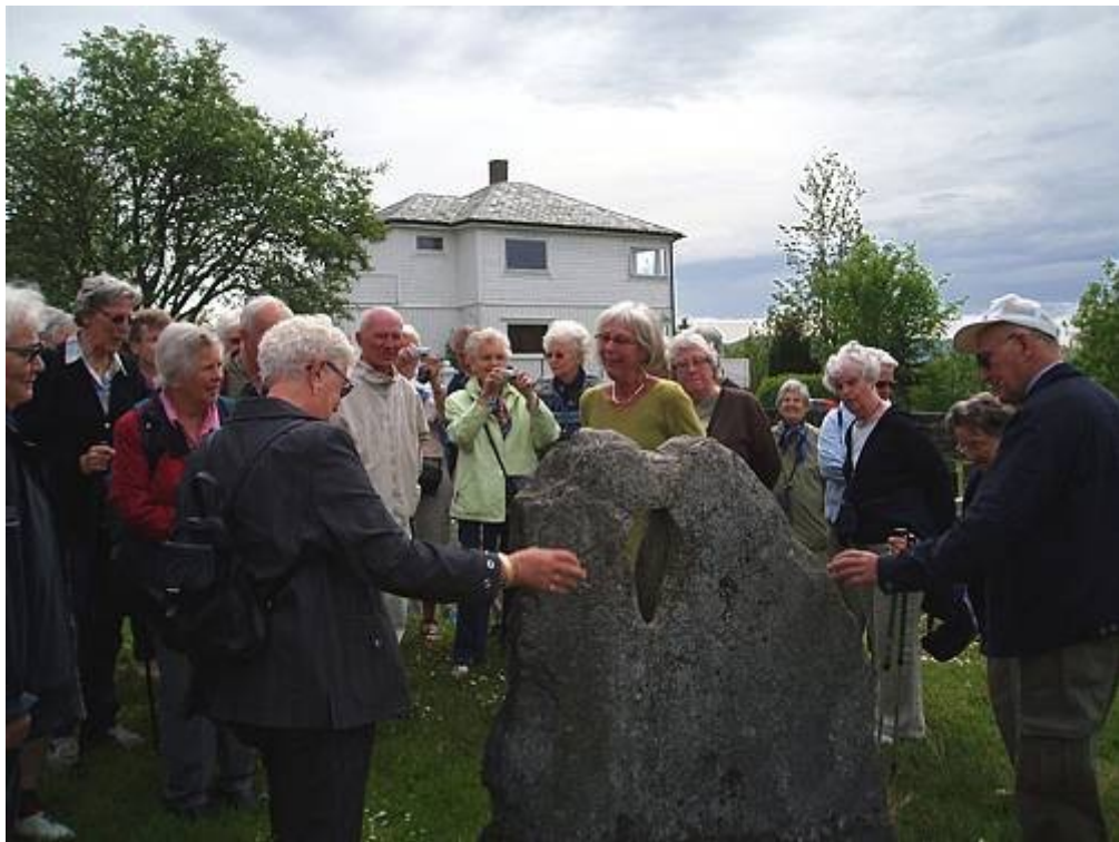
Rundt "Avtalesteinen" ved Moster kyrkje