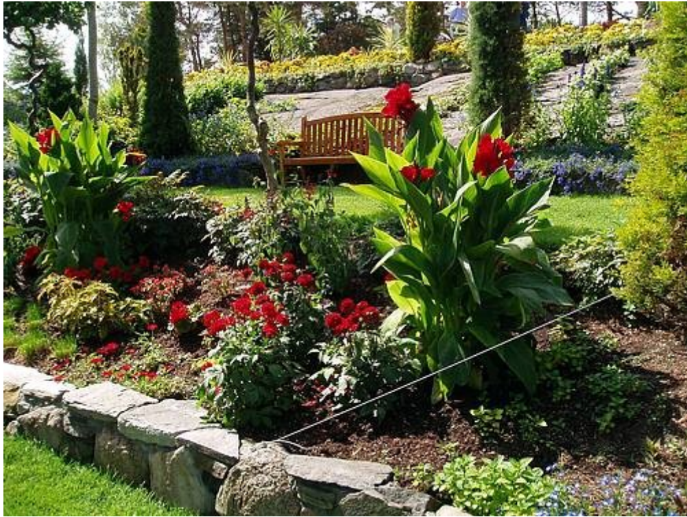
Flor og fjære - Sør-Hidle