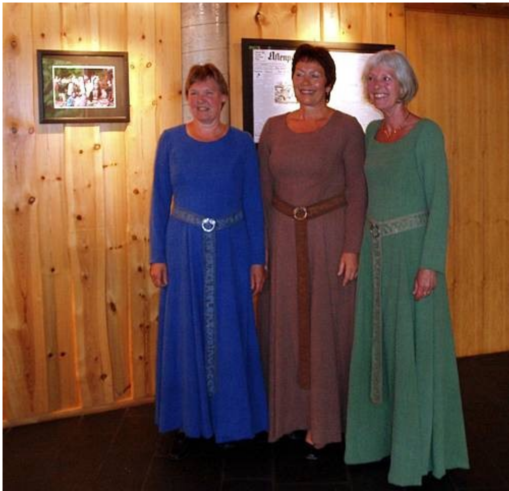
"De tre gratier" ved Moster Amfi