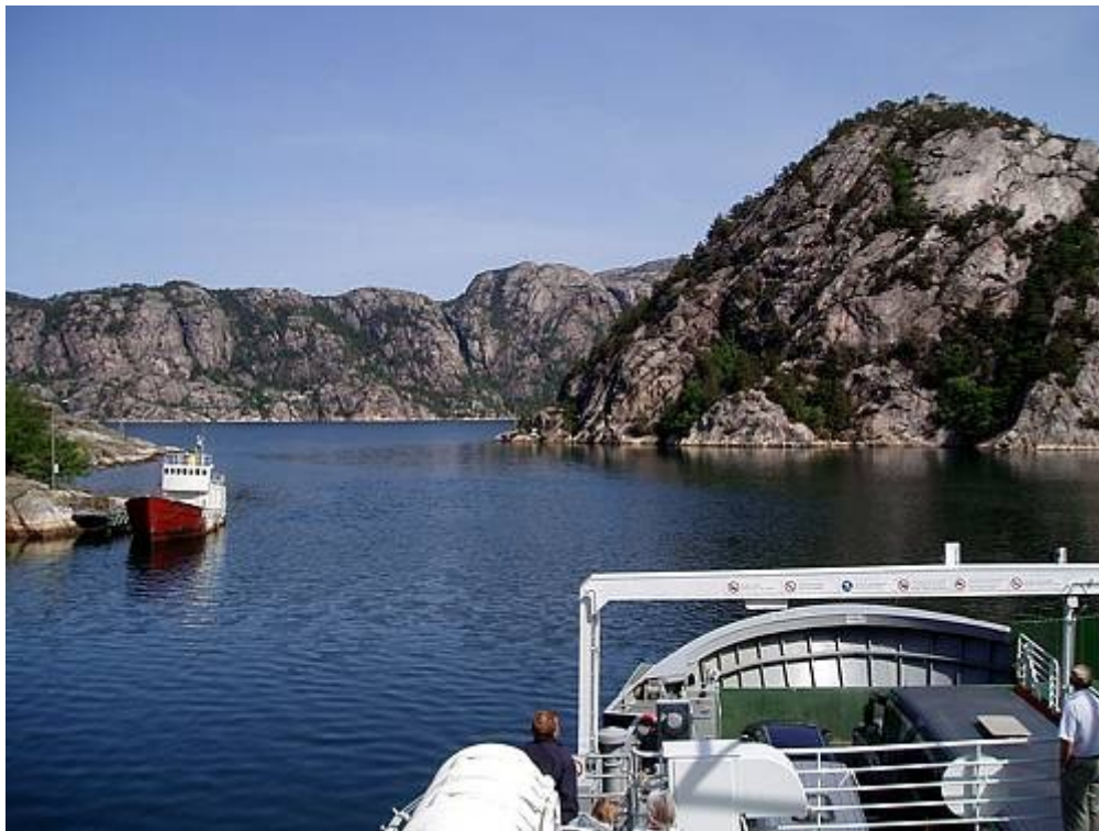
På vei inn Lysefjorden