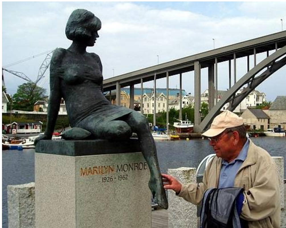
Som vanlig studerer fotografen motivet grundig