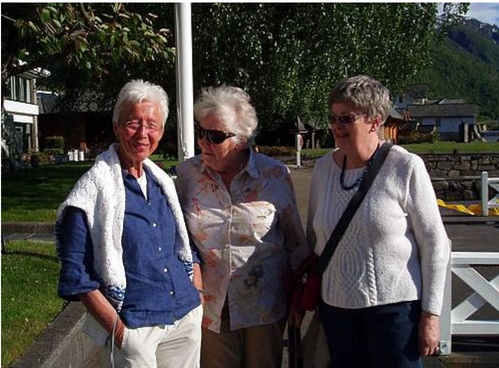
Ullensvang - utenfor hotellet