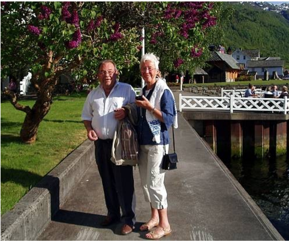
Utenfor Hotell Ullensvang