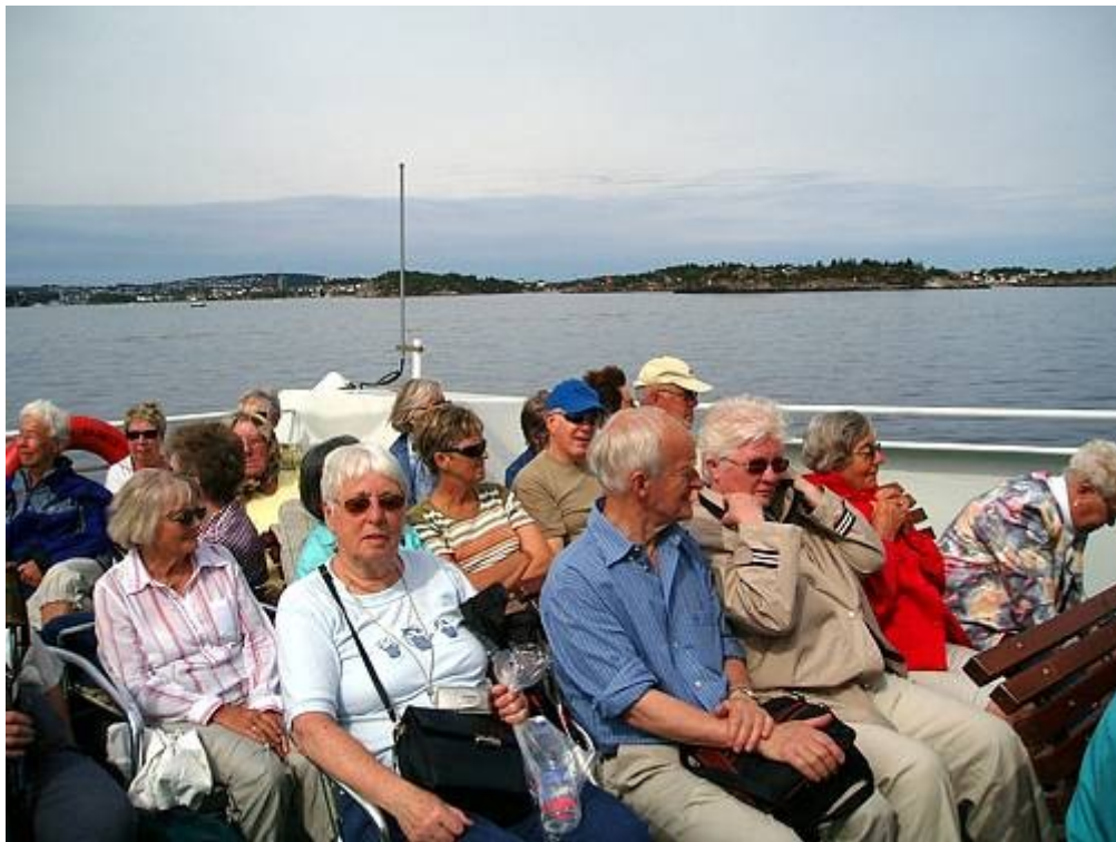
På vei til Sør-Hidle fra Stavanger