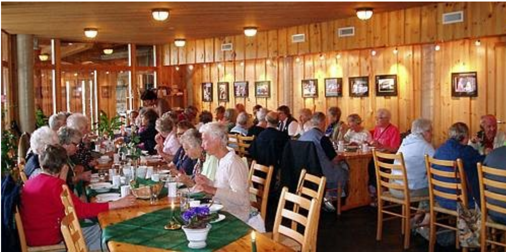
Moster amfi - Vikinglunch