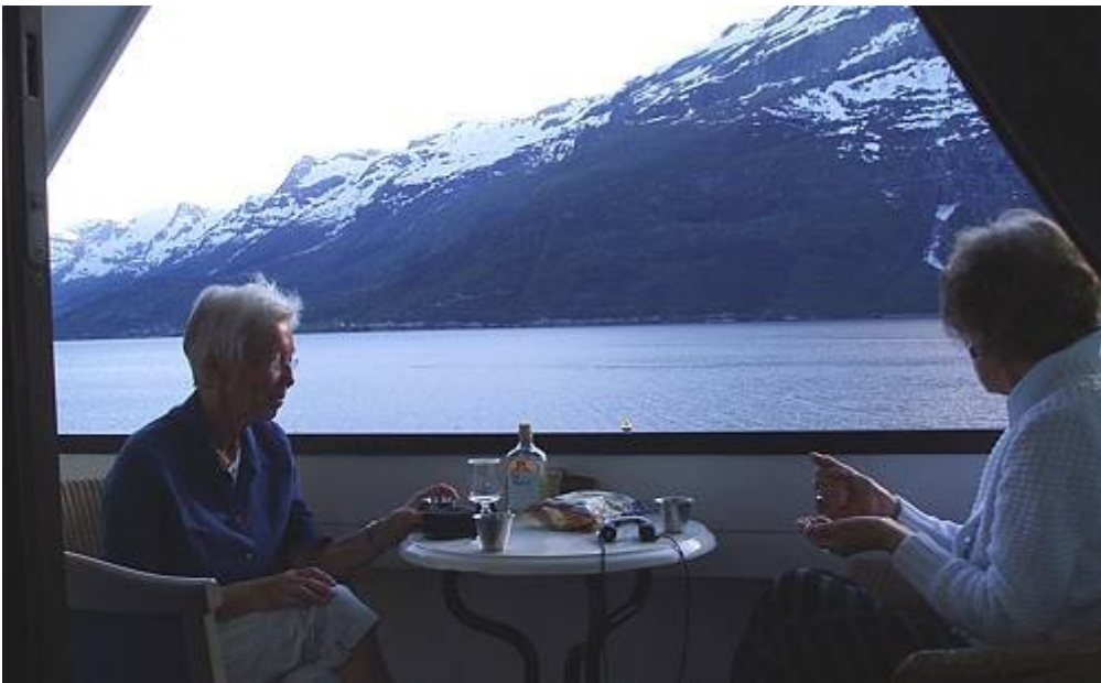
Ullensvang - utsikt fra hotellet