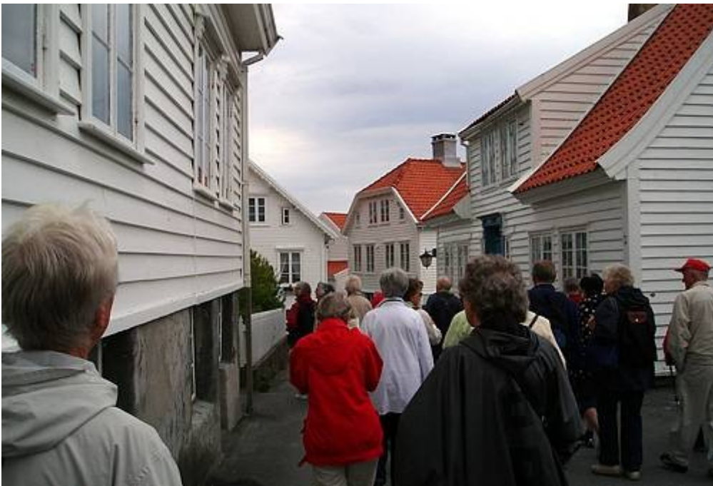
Sightseing - Skudeneshavn Karmøy