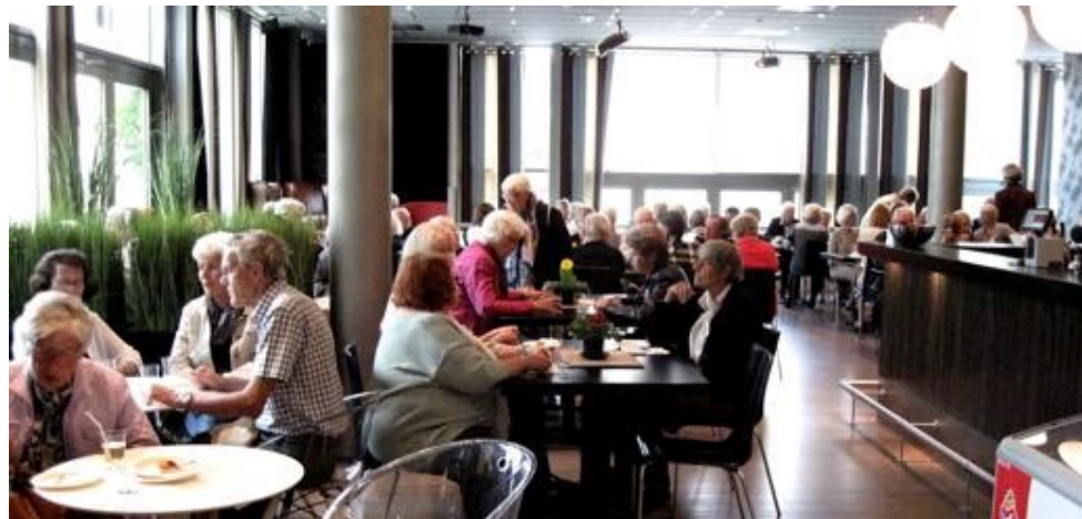
Jubileet begynte med sosialt treff og en enkel servering