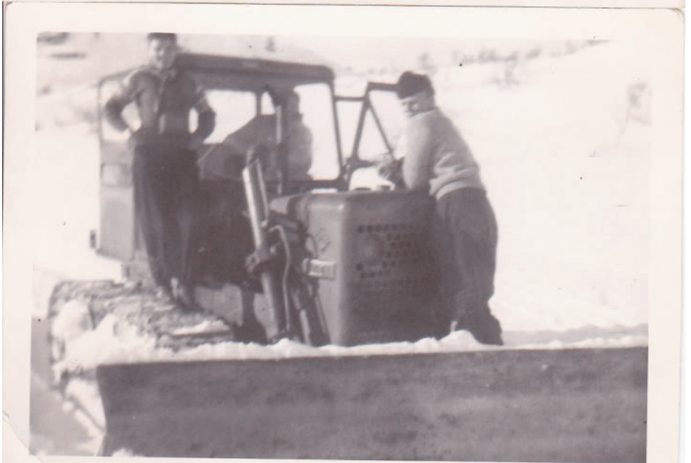
Bilder: Bildene over er fra Songa anlegget