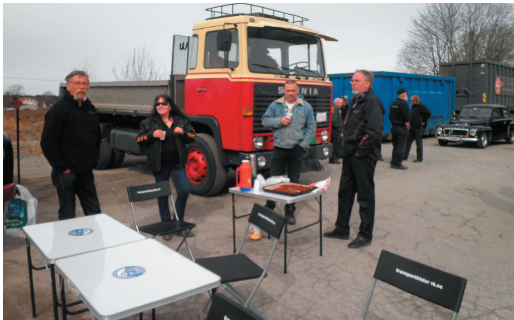
Bilder: Hyggelig prat ved Nebbenes før start, med sjokoladekake og kaffe)

for den nye «Verkensbrua», der «Nebbenes» er et begrep den dag i dag for mange veifarende.