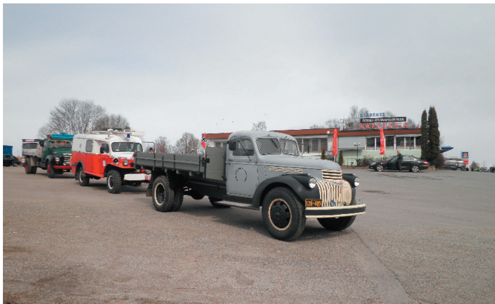
Bilde: Klar til start foran Nebbenes

For første gang arrangerte Transporthistorisk forening kjøring også på Øvre Romerike. 14 biler stilte ved Gamle Nebbenes like ved Eidsvollsbygningen på formiddagen 1.mai. Kjøreturen ble bestemt bare få dager før, så det var imponerende at såpass mange biler stilte. Det kom også tre biler fra Solør, som syns det var veldig greit med noen færre mil å kjøre enn Drammensturen. Gamle Nebbenes ble valgt som oppmøtested fordi serveringsstedet er transporthistorie i seg selv.