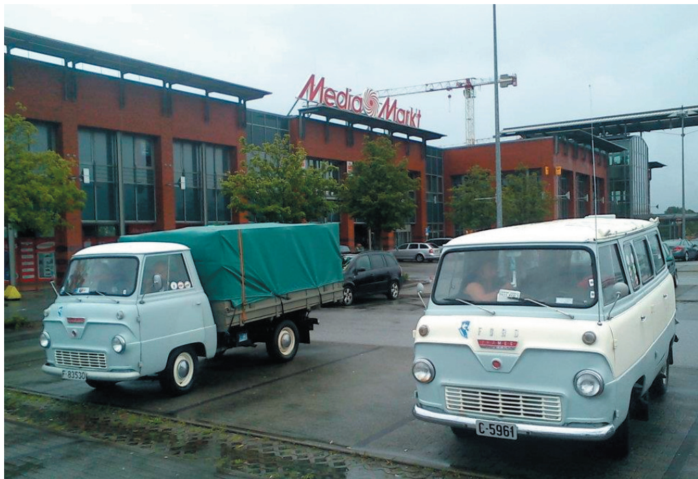
Bilde: Utenfor et kjøpesenter i Flensburg.