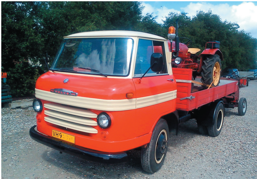
Bilde: Volvo L 430 Gammel norsk sivilforsvarsbil.

Da vi var kommet nesten til Esbjerg, var det kveld og tid for overnatting. Folk med vanlige bobiler kikket undrende på oss da vi glei inn på camping. Blitzlampene blinka i et sett, dette var nesten som å vinne 50-kilometer'n i Kollen! Dagen etter skulle vi over til østkysten. Etter et lite styremøte blei vi enige om å legge turen inn om Tyskland, vi måtte jo for f...ned på kontinentet slik at vi også kunne betegnes som utenlandssjåfører. Turen gikk til Flensburg, hvor vi var innom for å kjøpe oss litt øl. Deretter gikk turen nordover, og om kvelden kom vi fram til vennene våre på feriehuset. Morgenen etter var vi inne i nærmeste by for å handle. Der fant vi en plakat ang. et traktorstevne. Etter litt kjøring hit og dit fant vi stedet, og der var det mye gammelt og interessant og se. Masse gamle traktorer og treskemaskiner, og jaggu fant vi to gamle lastebiler også. Den ene hadde faktisk vært en norsk sivilforsvarsbil.