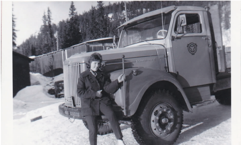
Bilde over: Ved Vinje sag med mamma på skjermen