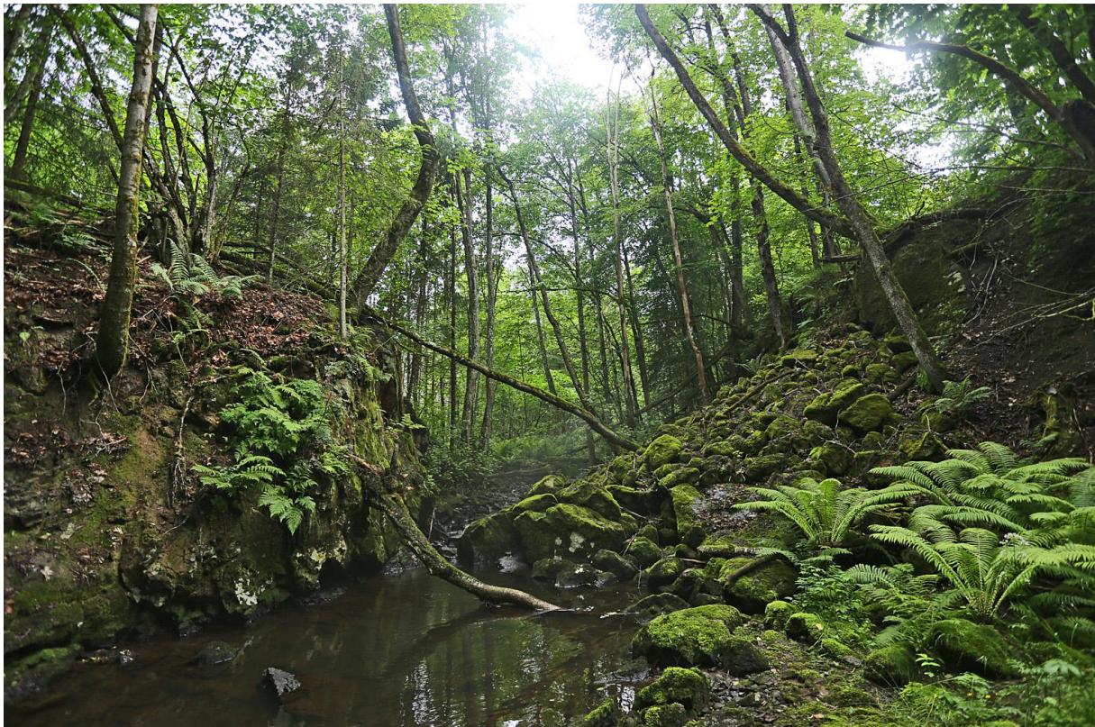
Et spennende parti fra Stokkerelva – grenselven mellom Bærum og Asker.

Bærum Elveforum ønsker å følge opp disse politiske signalene i det videre arbeidet i 2020.