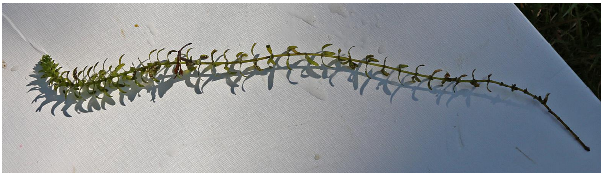
Den fremmede skadelige vannplanten vasspest ( Elodea canadensis ) fra Glitredammen.

Vi opprettet Bærum Elveforums elveoppsyn i 2019. Oppgaven er å gå elva minst en gang på våren og en gang på høsten (men helst oftere), og informere om ulovligheter og uønskede situasjoner som har oppstått. Slike kan være inngrep i kantsoner, utslipp og avfall. Følgende elver/bekker skal befares: Sandvikselva, Dælibekken, Isielva, Lomma-Øvre, Lomma-Midtre, Lomma-Nedre, Øverlandselva og Eiksbekken.