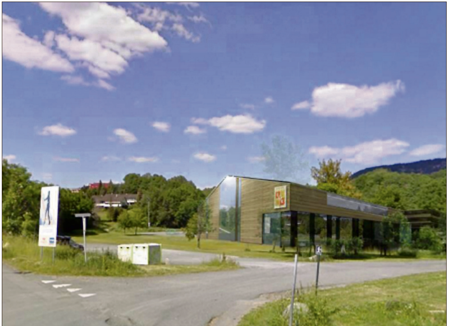
PLANENE: Slik ser Eiksmarka tennisklubb for seg den nye tennishallen på Barketomta, sett fra Fossumveien.

Både lov og forskrifter stiller krav til elvebredders naturtil-