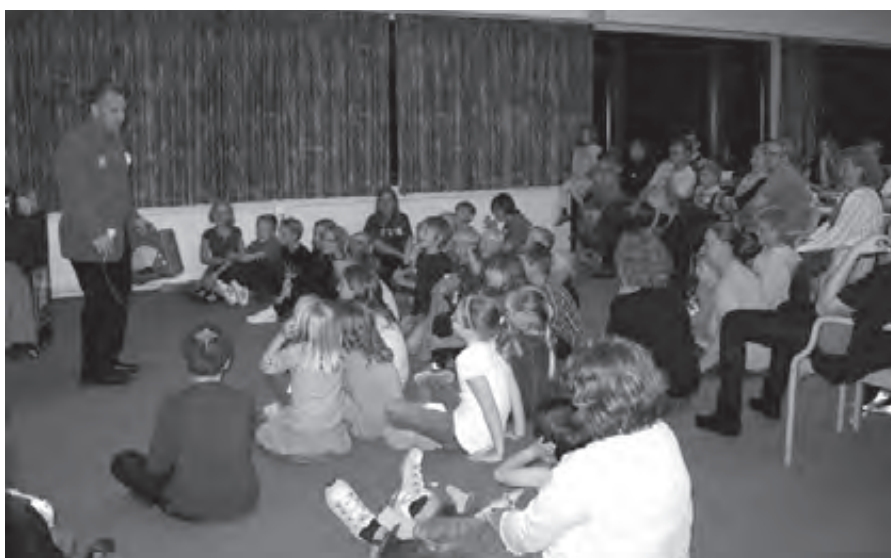
En klovn avsluttet barneopplegget på lørdagskvelden og han var skikkelig morsom.

get som var en klump hadde delt seg i 4 celler og til der var 7-8 uker. Det vi trodde var ører, viste seg å være øyne som kom inn fra siden. Den må vi prøve å vist en gang på et norsk møte! Alle har vi jo hatt spalte, så tidlig i livet.