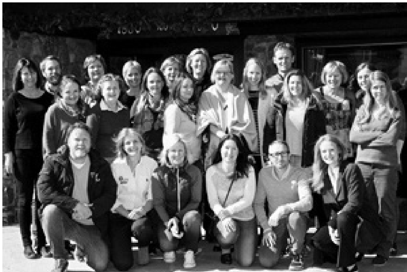
Bergensteamet på Geilo 2015

I den forbindelse er det bestemt at 2 ekstra operasjonsstuer skal brukes til slike med operasjoner hver uke i 2018.