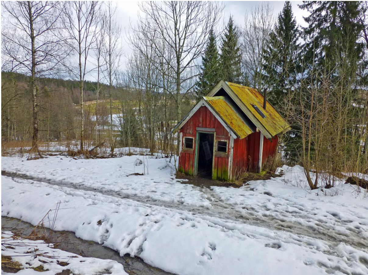
Saghytta ved Murenveien nær Øverland står for fall