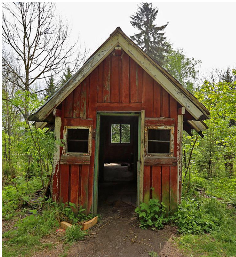
Saghytta ved Murenveien

De av våre medlemsorganisasjoner som selv ikke har betalende medlemmer skal ikke betale kontingent.