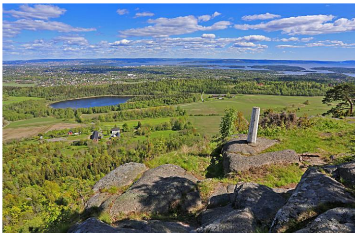
Kolsås-Dælivann kåret til Bærums flotteste friluftsområde.