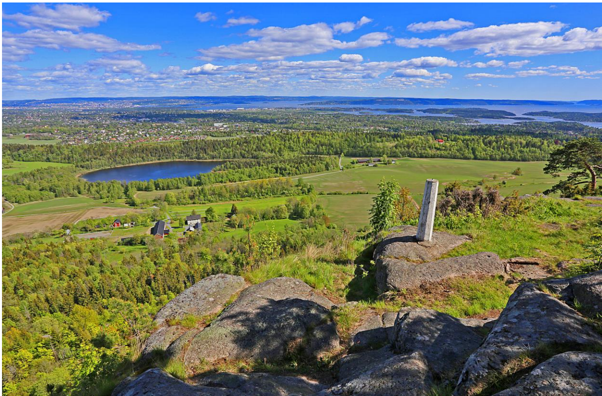
Utsikt fra Gråmagan (Kolsås) retning øst mot Dælivannet som også ses på bildet.

Kolsås-Dælivann er et område som "har absolutt alt": gammelt kulturlandskap, stillhet, spor etter tidlige bosetninger, fortsatt landbruk og frodige gårder, gamle husmannsplasser, rikt fugleliv, insekter, blomster og trær, stier og utløe, en mosaikk av naturtyper fra sumper, bekker og ferskvannsområder via rike kulturmarksområder til varierte skogsmiljøer. Interessant geologi og spennende topografi; flate kulturmarksområder, bratte lier, stup og rasmarker. Og de to flotte utsiktstoppene, bygdeborger, godt stinett, natursti med skilt, klatretraseer. Og vinterstid kan man pilke etter abbor, mort og gjedde, gå på skøyter på Dælivannet i tillegg til å gå på ski i nærområdet.