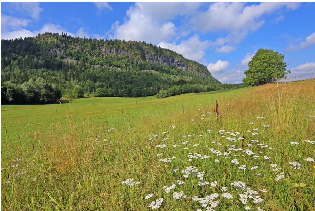
Idyll ved Jordbru og Ramsåsen en flott sommerdag

Markarådet er et organ som ble opprettet i forbindelse med markaloven, som trådte i kraft i 2009. Loven åpner for å opprette et markaråd som har en ombudsmannsfunksjon og bidrar til å fremme lovens formål om å fremme og tilrettelegge for friluftsliv, naturopplevelse og idrett.