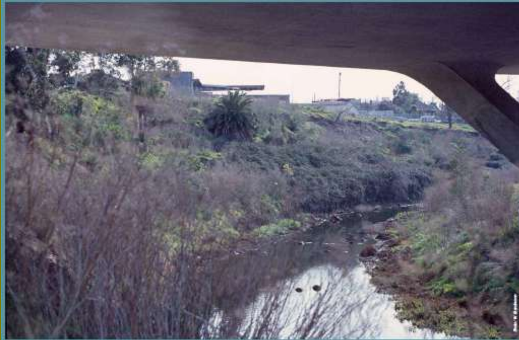
Before: the Eastern Freeway spanning the banks of the Murr in 1982.