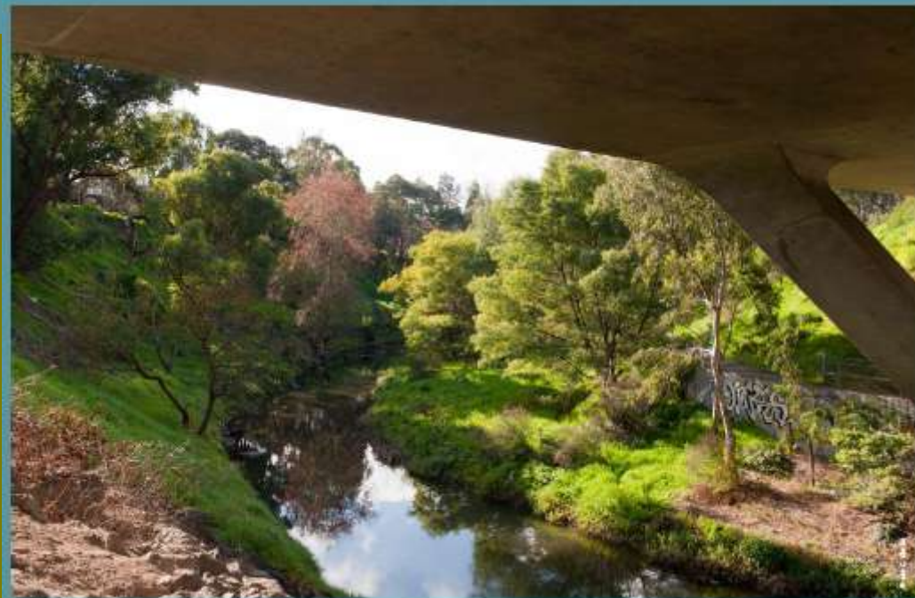
After: the same view in 2015.