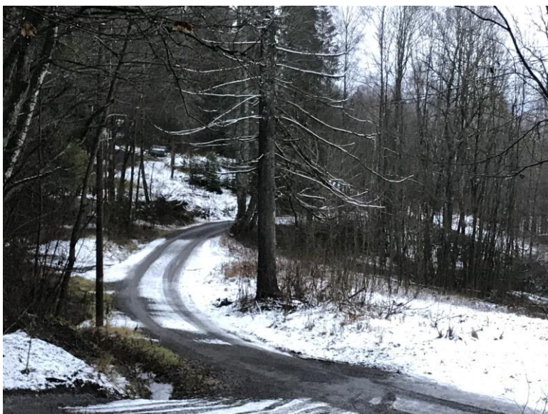
Fremdeles er det uberørt natur å finne i området ovenfor Isi. Men hvor lenge varer det?

I områder som grenser mot Isi Miljøpark ligger naturreservatene Enli, Isi, Kjaglidalen og landskapsvernområdet Djupdalen. Gjennom området går gamle veifar, stier og veier som gjør det mulig å ta seg inn i området for de fleste. Berger og Rykkinn vel mener at industrialiseringen av områdene ved Isi Miljøpark allerede har gått for langt, og går sterk mot ytterligere utvidelser. «Vi ber derfor fylkesmannen avvise søknaden», konkluderer velstyret.