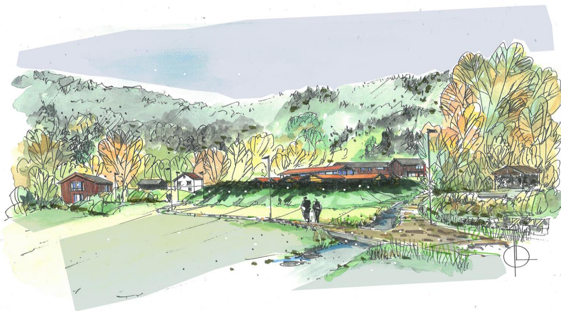
Illustrasjon av det nye stjernebygget som Bærum kommune vil bygge på jordet ved Brekkeski.