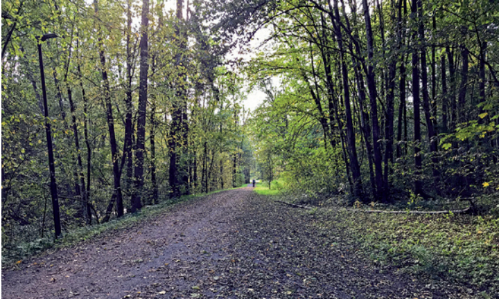
Turveien fra Blomsterkroken mot Kloppa er omkranset av gammel skog.

Blomsterkroken har navn etter gartnerier som tidligere lå i nærheten av elva. Bærum kommune har i dag to målestasjoner her. Målestasjonen for vannstand ligger oppstrøms for kulpen, og det lille huset nedstrøms for kulpen inneholder målestasjon for vannkvalitet.