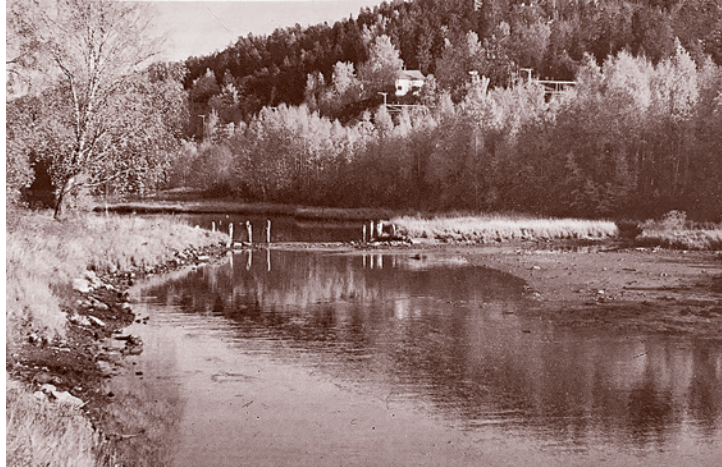
Prosjektet med «saltvandsparken» (punkt 30) lyktes ikke, og mesteparten av sperringene (restokkene) ble fjernet etter få år. Likevel kunne man til utpå 1980-tallet, da dette bildet ble tatt, se en god del av dette stengselet fra Rønne elv (Norges korteste elv med eget navn).

Engervannet var, sammen med Hunnbøtn i Borge i Østfold, Norges første oppdrettsanlegg for laks og sjørret i «saltvand». Gårdene Løkeberg, Løkke og Blommenholm gikk 10. februar 1869 sammen om et oppdrettsanlegg for ørret og laks i Engervannet. Yngel skulle slippes ut i Øverlandselva og etter et par år ville de gå ned i «saltvandsparken» i Engervannet og vokse seg store. Ved Engervannets utløp skulle et stengsel hindre fisken å komme videre ut i havet. De to-tre gamle stolpene på den lille øya i Engervannssøset er de siste synlige rester av denne saltvandsparken fra 1869.