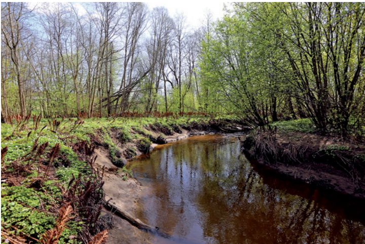
Summen av artsfunn, utforming og sjeldenheten i dette landskapet gir verdi som er svært viktig – A-verdi.

Området ligger omkranset av golfbane og åkerland mellom Øverland gård og Haga. Ifølge Miljødirektoratets Naturbase består området av eldre løvskog på rik og fuktig grunn som tidvis blir oversvømmet, meanderende elvepartier, åpne fuktenger og noe eldre hagemarkskog på tørrere grunn.