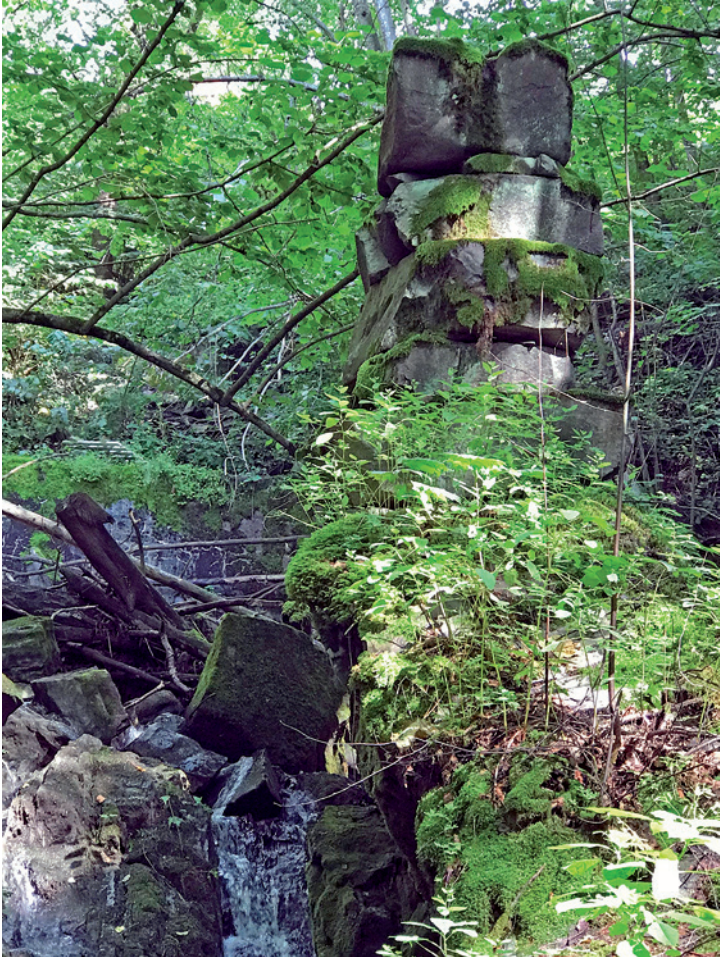
Det er få spor i dag av de gamle kvernene langs elva. Men i Kvernfossen ved Løkeberg står denne pilaren etter en vannrenne. Se punkt 21 på andre siden.

Øverlandselva Øverland, Hans: ligesaa 1 ort skat – Haslum, Erik: ligesaa 1 ort, 12 skilling skat – Ramstad og Høvik: I Løkebergelven, 1 kvern forfalden og ringe, 1 ort skat.