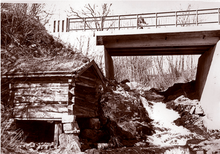
Den originale kvernen er borte, men fra 1963 og frem til 1975 lå dette kvernhuset fra 1700-tallet nedstrøms for Øverlandsbroen. Den ble flyttet hit fra Valle i Setesdal. Bildet er fra ca 1970. I dag står kvernen ved Mølleedammen på Vøyen gård.

Den gamle steinbroen over Øverlandselva ble reist i 1838, og er godt bevart. Gamle Ringeriksvei ble lagt om i 1891.