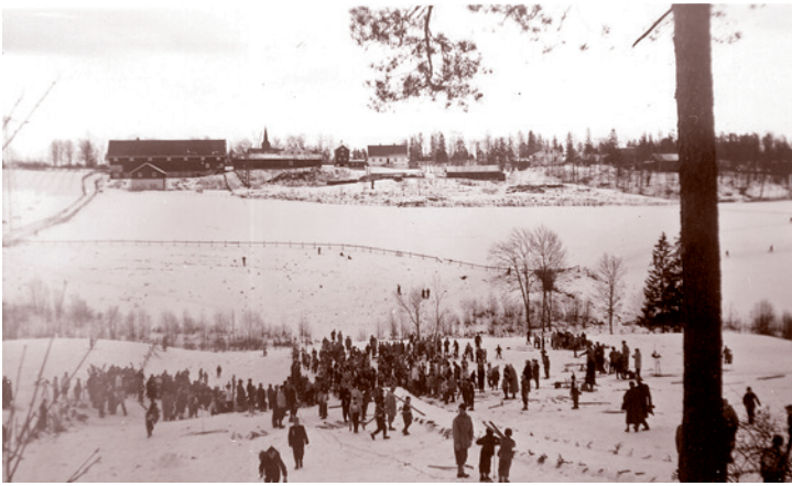
Hoppbakken ble brukt regelmessig, og Haslum skole holdt sine årlige skoleskirenn her på 1950- og 60-tallet. Stabekk folkeskole holdt også sine skirenn her med slalåm og hopp. Bildet er tatt vinteren 1953.

Hoppbakken ble anlagt på 1930-tallet, og lå i sørenden av Øverlandsjordet, der trafostasjonen ligger i dag. Bakken hadde naturlig tilløp og snøhopp. Øvarennet gikk langt opp i åsen mot Edelgranveien. Unnarennet, som var ganske flatt, men bratter enn hellingen på dagens jorde, sluttet rett i elvekanten. En periode var det slalåmbakke der også, og det ble holdt slalåmkurs og kjørt «utfor». På 1950-tallet ble det tradisjonelle Øverlandsrennet holdt hvert år med deltagere fra hele Østlandet, og det kunne være bortimot 400 deltagere fra 7 til 14 år. Hoppplengen var maks 25 meter. Det gikk fulle trikker fra Oslo til Haslum med hoppere og foreldre. Bakkene ble borte da det ble anlagt søppelfylling på området rundt midten/slutten av 1960-tallet.