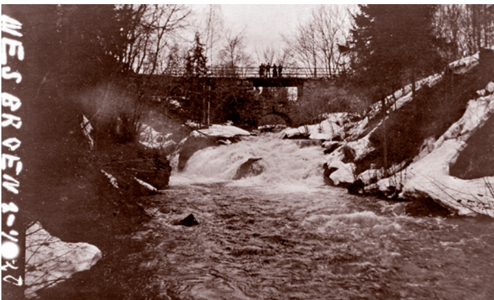
Nesbroen anno 1920.

Broen over Øverlandselva ved Nes gård fører Nesveien videre til Haslum. Brostedet her er gammelt, fra da strekningen Sandvika-Evje-Nes-Haslum kirke ble rodelagt i 1826, noe som innebar et offentlig pålegg om at tilgrensende gårder skulle vedlikeholde veien. I 1891 ble veien utbedret og Nesbroen løftet, frem til det i 1926 ble bygget nye brokar og sidemur. Disse brokarene har siden fått stå, mens det er støpt nytt dekke over.