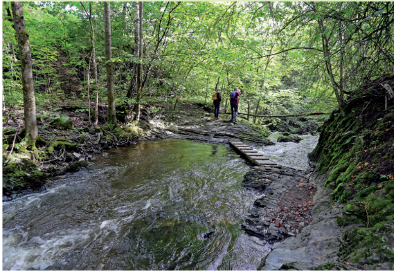
Kvernfossen. De røde potteskårene langs elvekanten er fra det gamle pottemakeriet (se punkt 15 på andre siden).

Vi ønsker god tur! Hilsen Bærum Elveforum