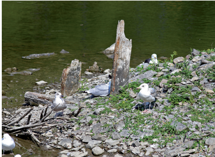
Disse stolpene på den lille øya i Engervannssøset nedstrøms Folangerbroen er i dag de siste synlige rester av dette stengselet fra Norges første «saltvannsuppdrettsanlegg» for laks og sjørret fra 1869.