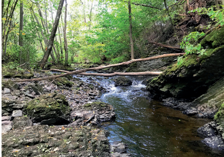
Lag av kalkstein og mørk skifer, som ble avsatt under vann for en halv milliard år siden, er senere trykket sammen slik at det oppstod folder. Bildet er tatt et stykke nedstrøms for Nesbroen.

Bærums geologi er berømt, og er en del av Ostfjeldet som strekker seg fra Mjøsa til Langesundsfjorden. Grunnforholdene i Bærum gjenspeiler mye av det som geologisk har skjedd de siste 600 millioner år. Også langs Øverlandselva er dette tydelig.