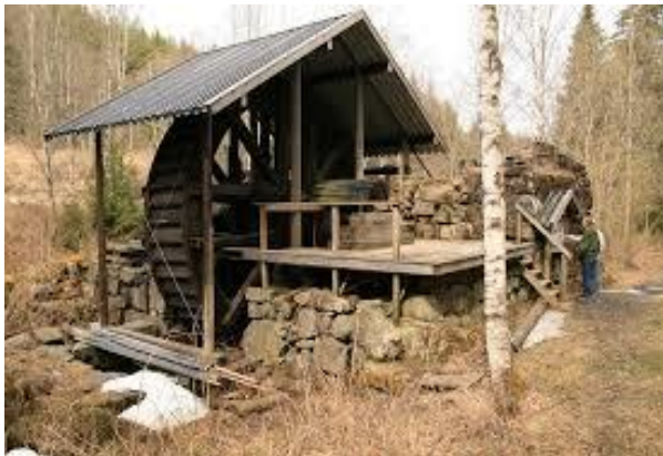
Vasshjulet ved Losby

Vi kommer etter hvert med flere detaljer om jubileumsåret.