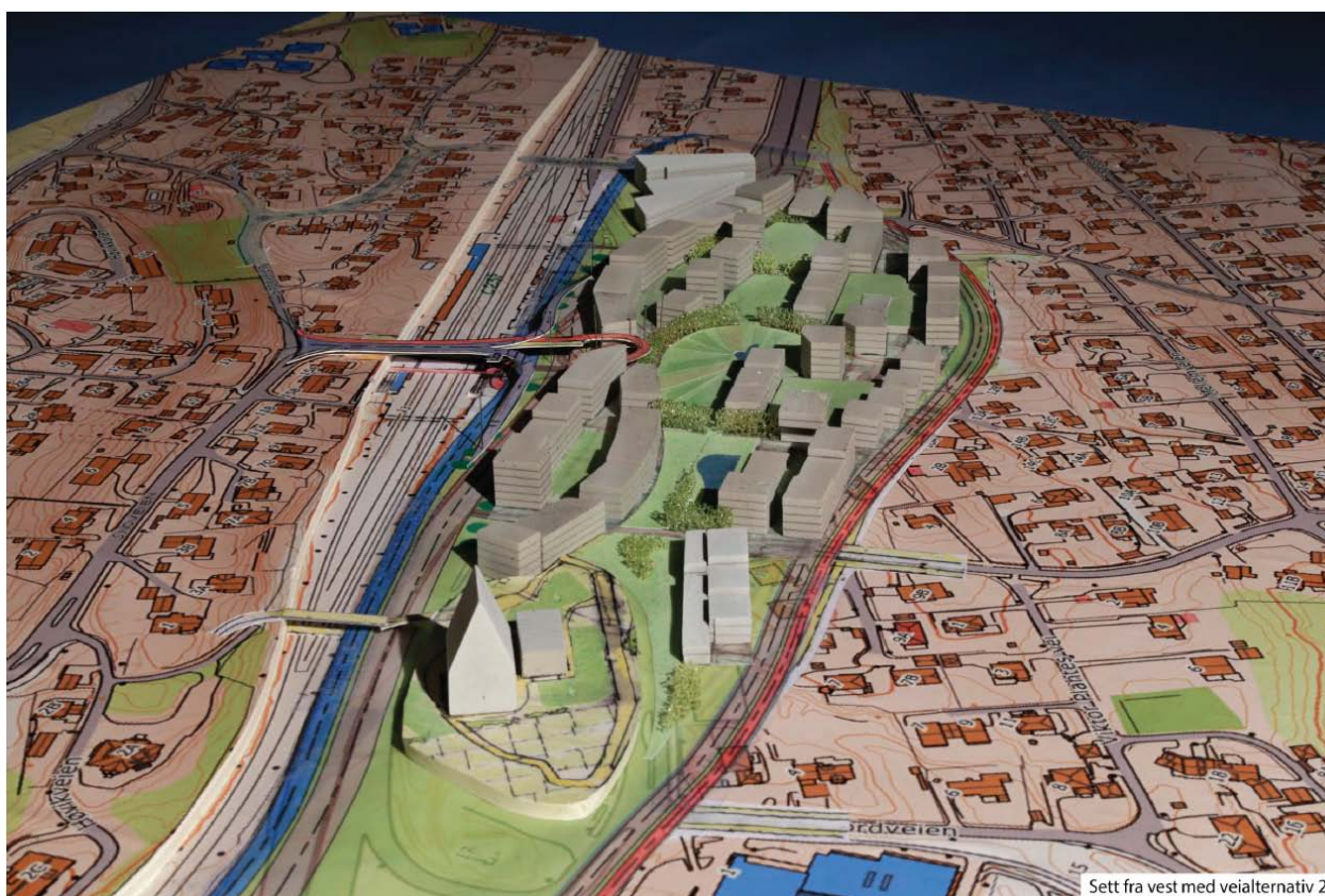
Forslag til Urban landsby Høvik, alternativ 2 modell sett fra vest ved arkitekt Niels Torp

Den nye lokalveien er i vårt forslag lagt parallelt med den blå bussveien og jernbanen på nordsiden av det nye Høvik sentrum. Man samler på denne måten alle vesentlige støykilder langs denne akse og benytter eksisterende støydempende elementer i forbindelse med jernbanen og nordsiden av de nye byggene som støyskjerm mot det nye Høvik sentrum. Høvikbroen er skåret av og det er lagt kjøreramper ned til den nye lokalveien slik at det nye Høvik sentrum ikke skal belastes med trafikken som kommer til eller fra Høvik nord for jernbanen. Den grå Sandviksveien er tenkt lagt ned i terrenget og dersom det er mulig, stengt med bom eller lignende mot øst ved rundkjøringen slik at det ikke skal være gjennomgangstrafikk på denne strekningen. Det er