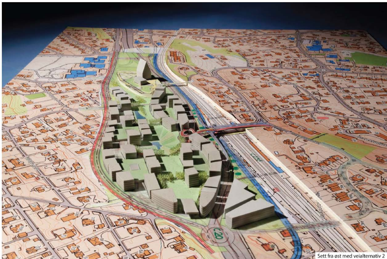
Forslag til Urban landsby Høvik, alternativ 2 modell sett fra øst ved arkitekt Niels Torp