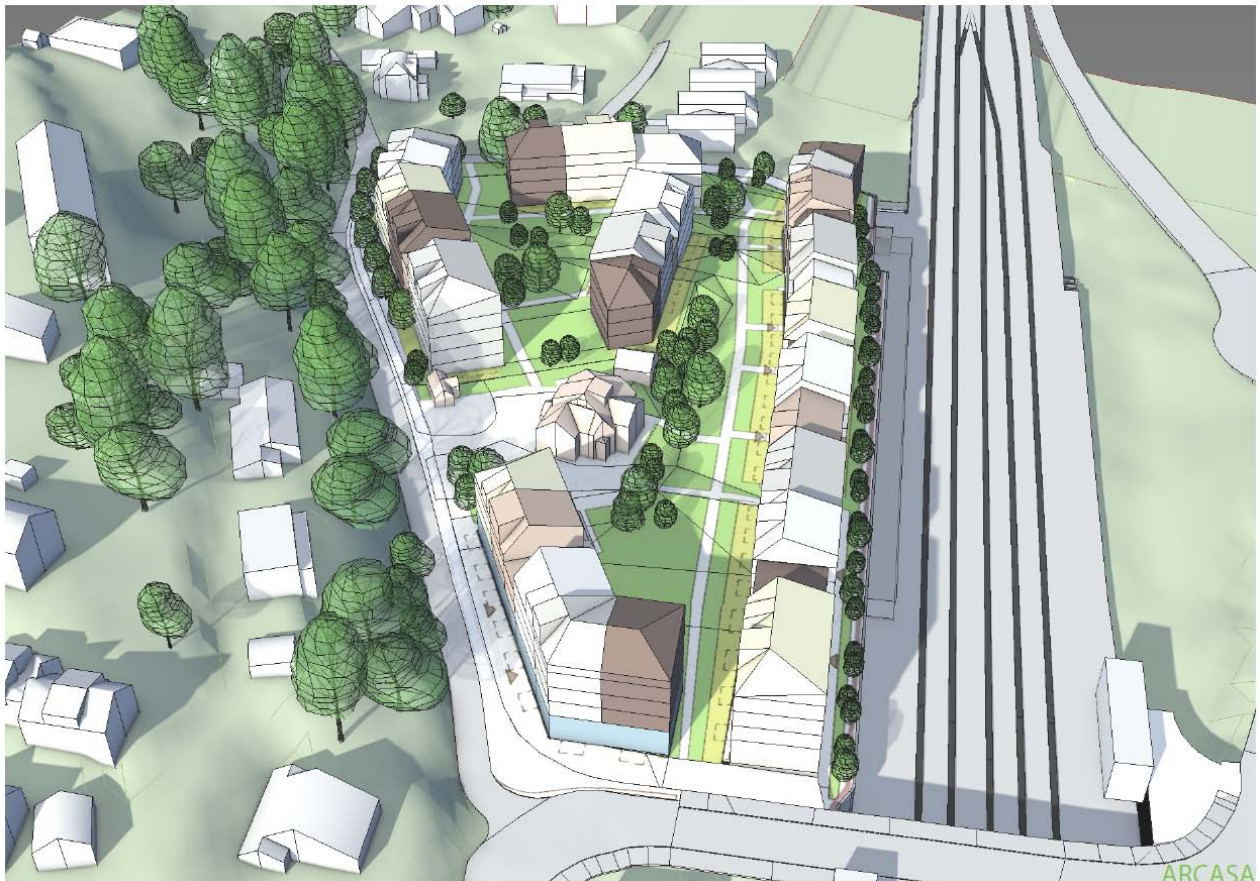
Snoveien 17&19 sett fra vest med Høvikbroen og Høviksvingen i forkant, tegning ved ARCASA

https://www.baerum.kommune.no/innsyn/byggesak/wfdocument.ashx?journalpostid=2019231800&dokid=4671030&versjon=1&variant=A&