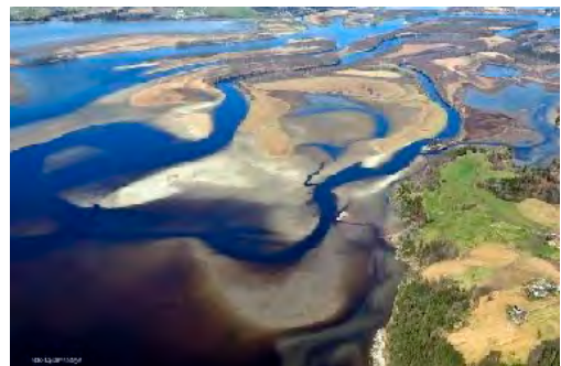
Nordre Øyern, Fetsund lenser.

Tur i kulturlandskapet på Romerike. Sted og tid kommer.