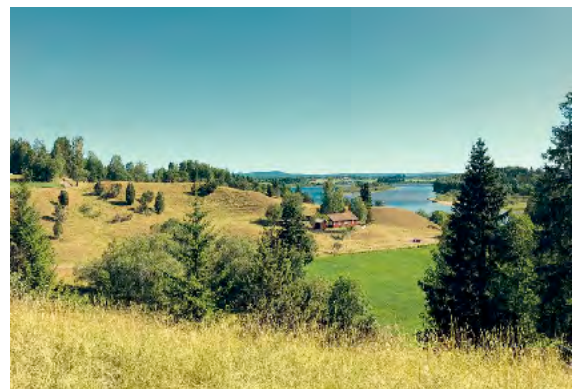
Ullershovfallet, husmannsplass ved Nes kirkeruiner, del av turveien ved arrangementet Vegalangs i Vormadalen.

Klikk på denne lenken og les om KULA: https://www.riksantikvaren.no/Prosjekter/Kulturhistoriske-landskap-av-nasjonal-interesse-KULA