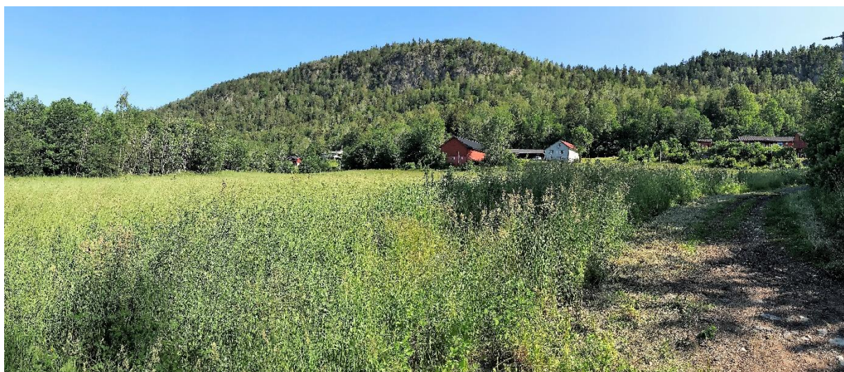
Det aktuelle området or utbygging

«Ut fra en samlet avveining av de ulike hensyn og behov og på bakgrunn av høringsinnspillene er rådmannens vurdering at alternativ 1, tunet på Nordby gård, er det minst konfliktfylte og det alternativet som raskest kan realiseres»