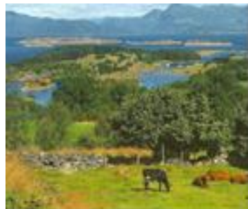
Utsikt fra Eikåsen.

Dette tilbud er for ALLE - store og små. Også firbente - i bånd.