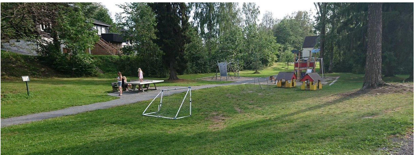
De grønne lungene der vi bor er gull verdt. Fra Søråsenparken mellom Søråsen og Kleivveien.

Bekkestua Vel mener blokkene får bygges rundt kryssene i Bekkestua sentrum, og der det er småhus får det bygges småhus som passer inn. Og så må vi selvsagt sikre nok grøntområder!