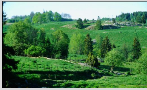
fra Klokkerhagan sett mot Ås kirke 1989