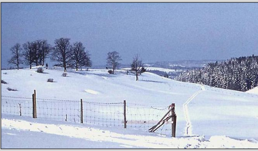
Nordbyenga med eikelunden 1972