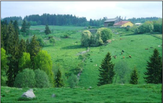
Norderås med Klokkerhagan 1987