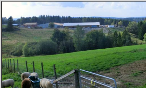
Ås Gård sett fra Norderås 2014