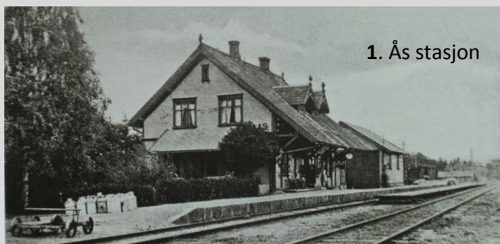
1. Ås stasjon