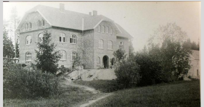
Aas skole nybygg 1913

5. og 6. Skoleveien. Banken og skolen fra 1913-14 fikk en framtrødende plassering, høyt og fritt.