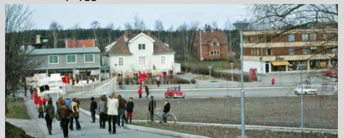
utsyn fra Åsgård 1. mai 1972

7. Rådhusplassen med Erik-Johansens butikk/Solstad fra venstre og nye Åmodtgården til høyre i bildet. I bakgrunnen skimtes bebyggelsen i Raveien