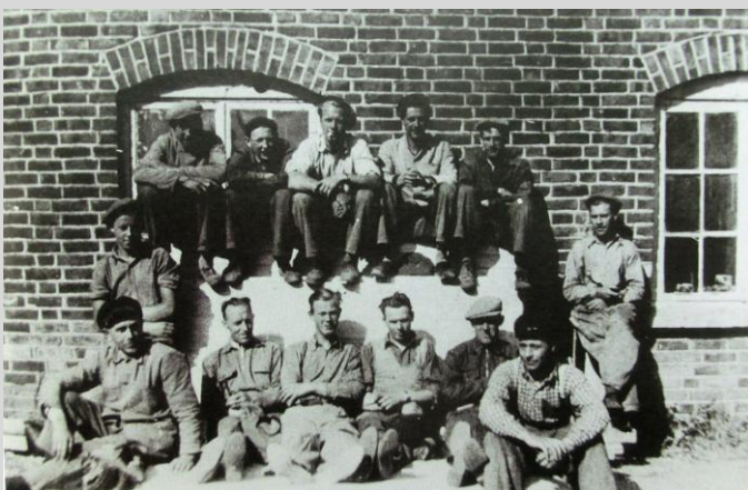
Blakstad, Moerveien 17, trevare- og snekkerbedrift