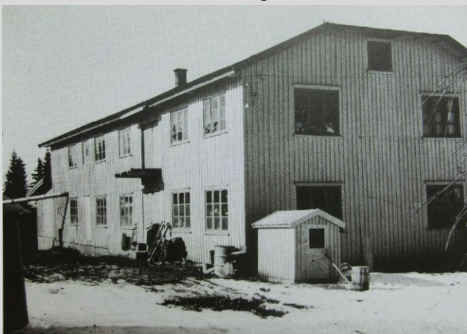
Ås møbelfabrikk, Brynildsen, Moerveien 29

4. Sagaveien er oppkalt etter Skuterudsaga. Her var det også et stort gjestgiveri. Bygningen står i Sagaveien 3.