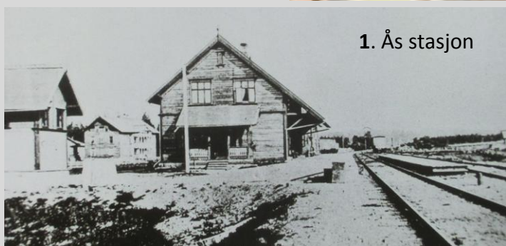
1. Ås stasjon