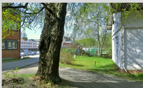
Raveien 2014, med Åser til høyre. Her var Skogforsøksvesenet i 1918. Helt til venstre lå tidligere Eriksens bilverksted. Den øvrige bebyggelsen innover i bildet ble revet i 2012

7. Rådhusplassen med Erik-Johansens butikk/Solstad fra venstre og nye Åmodtgården til høyre i bildet. I bakgrunnen skimtes bebyggelsen i Raveien