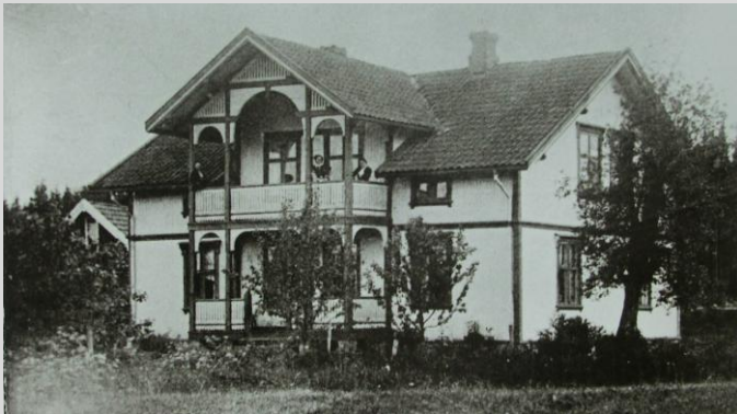
Nylund 1908, Moerveien 10 Under: kart over industri

2. Moerveien var den første "gata" vest for jernbanen i stasjonsbyen Ås. Her bygde ulike håndverkere seg hus og det ble etter hvert mange verksteder og bedrifter i Moerveien.