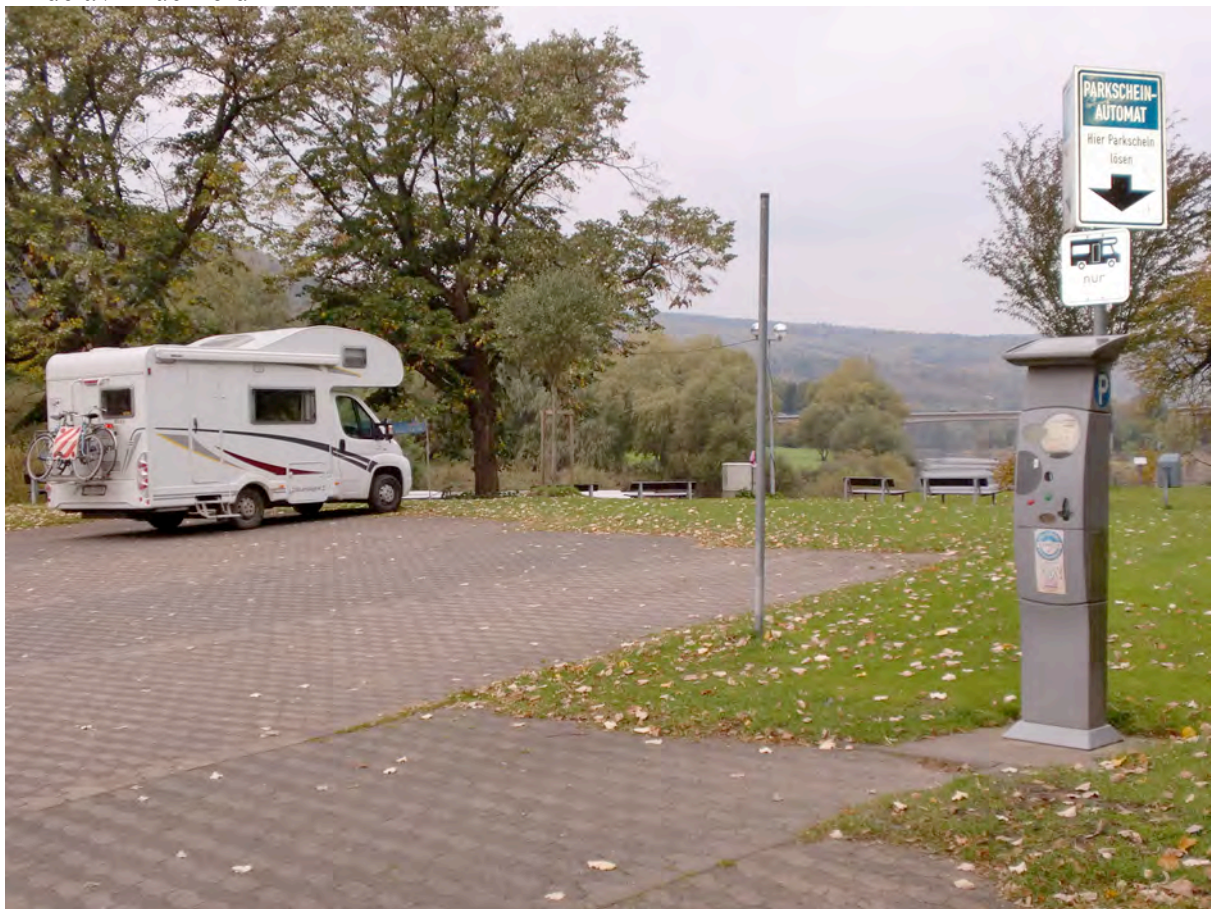
Bilde av Brückfeld

Vi kjørte småveier, røde og grønne til like før Hamburg . Tok motorvegen gjennom Hamburg, under Elben i tunnel. Vest i Hamburg til Wedel , pent sted ved Elben hvor båttrafikken går. Overnattet her. Kjørte nord/vestover til Gluckstadt ved Elben og så på trafikken. Her går det ferger hele tiden til den andre siden, trailere, vanlige biler og bobiler – 12 euro. I tillegg går de store containerbåtene forbi. Så til Itzehoe og Rendsburg ved Nord-See-kanal . Her går det en spesiell ferge over kanalen. Toget går over kanalen og ferga henger i jernbanens konstruksjon, artig oppfinnelse! Til Flensburg for ”bunkring” på Citti, stort shoppingsenter. I tillegg er det rimelig gass å få hos Färber Gas i nærheten av Citti, 17 euro. Gratis bobilparkering nord/øst i Flensburg ved småbåthavna, ikke strøm og vann, men mulighet for tømning på anvist sted. En rolig dag på vegen til Ebeltoft for overnatting på parkeringsplass ved ”fyrbaten” Skagens Rev. I uke 42 er det Ebelfestival, salg av epler, øl, brød, pannekaker osv, kan bese båten. Grenaa neste stopp for ferge til Varberg . Så var det kun en dansekveld i Uddevalla igjen av turen. Utgifter til overnatting på denne turen ble kr.340,-!