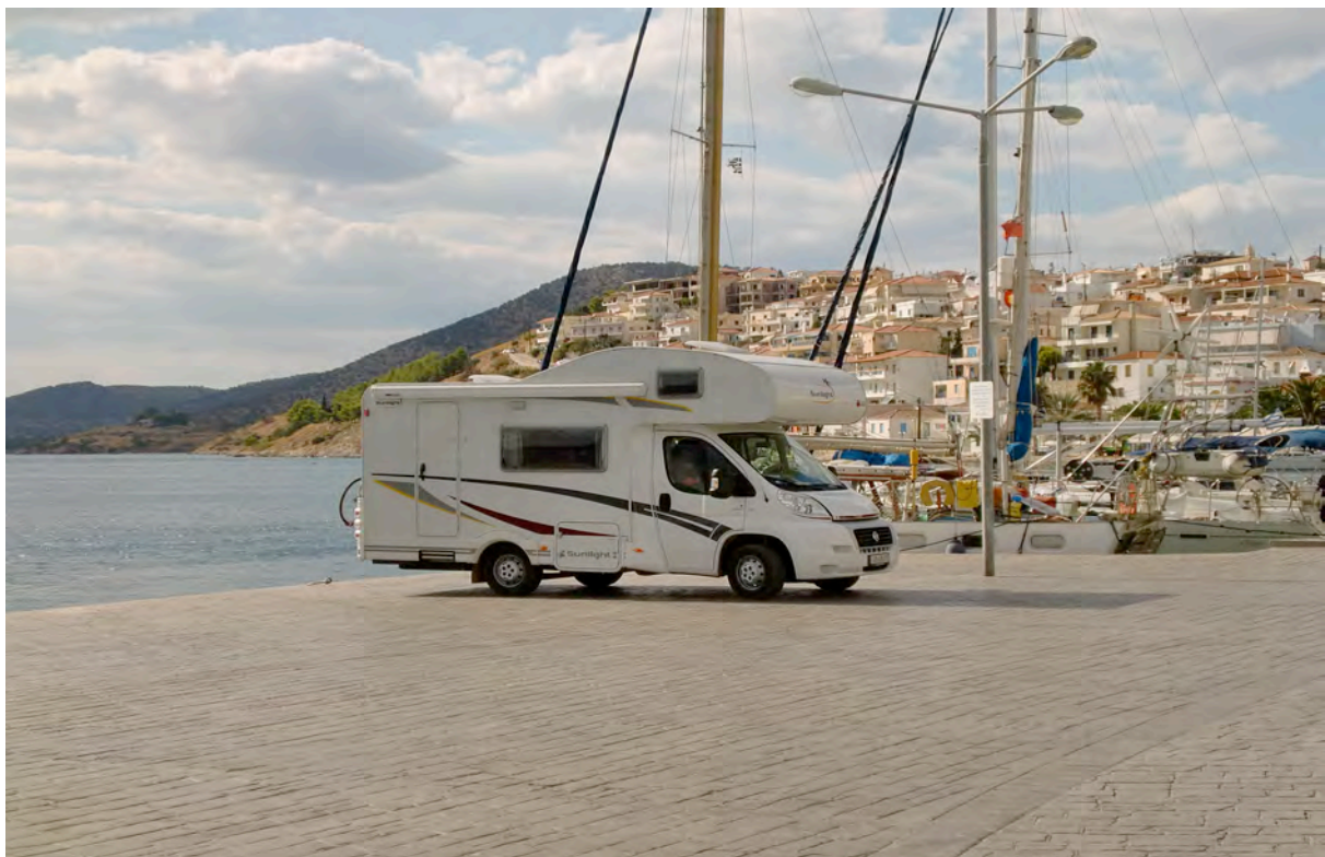
Ermioni, nydelig by, overnatting mulig

Galatas neste, her overnattet vi. Ferge går til Poros – 10 min. Nydelig sted med yachter ved havna. Her finnes både Dagbladet og VG.Liedl og Carrefour i Galatas.