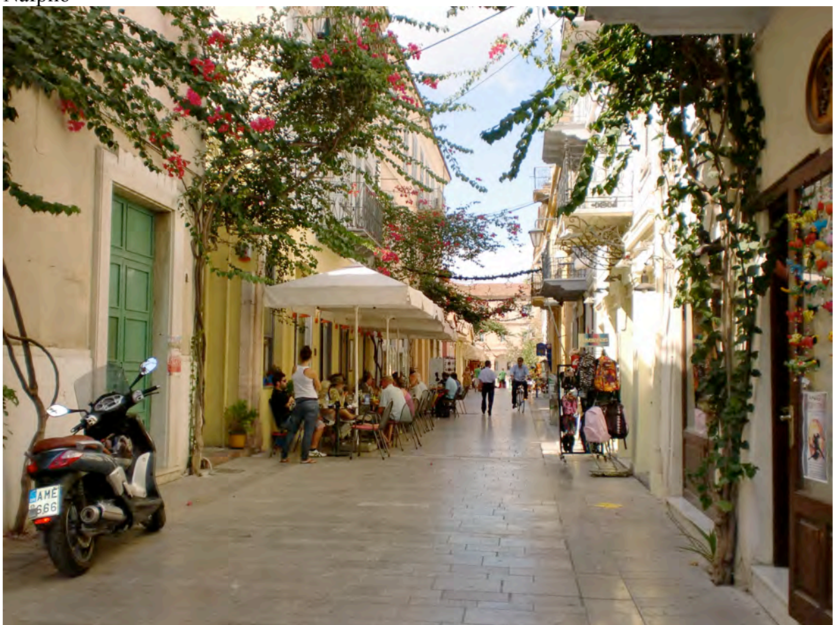
Gatebilde fra Nafplio.