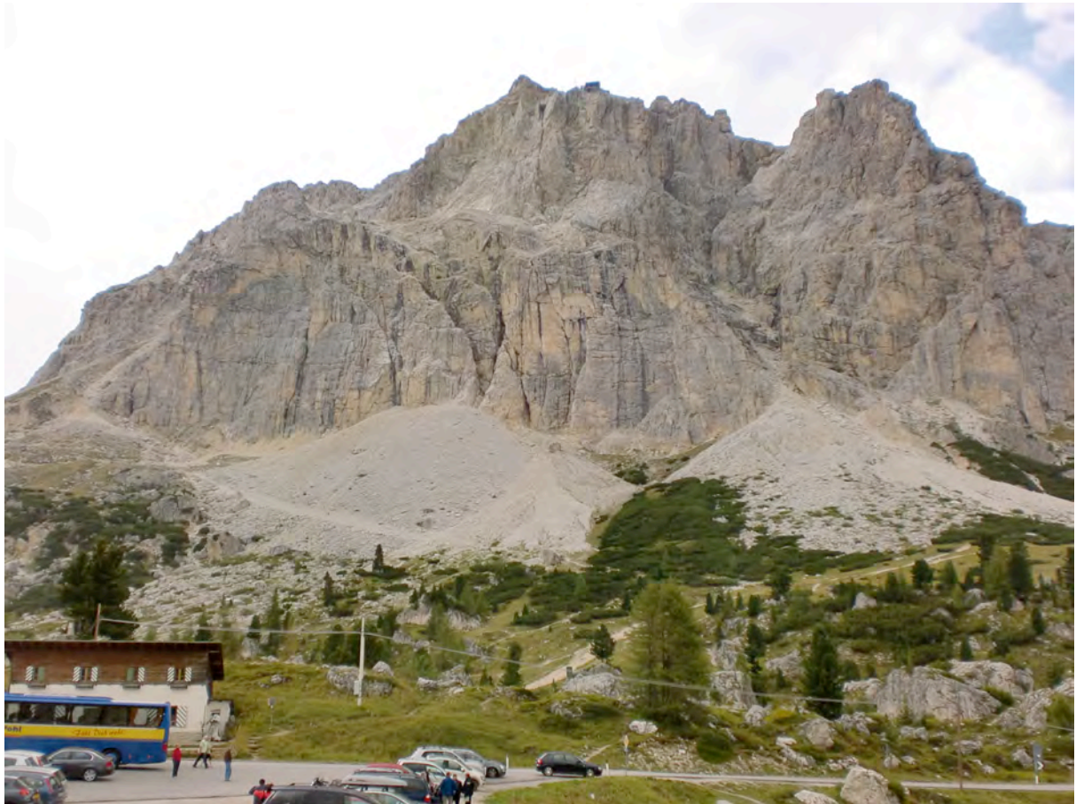
Og til Cortina d'Ampezzo. Nydelig hele vegen.