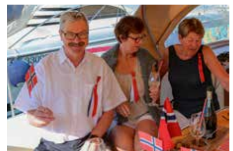
Nasjonal dag med sjampanje