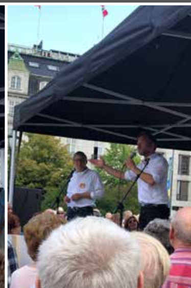
4 Audun Lysbakken