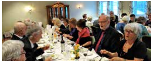
Hyggelig stemning når telepensjonister møtes.