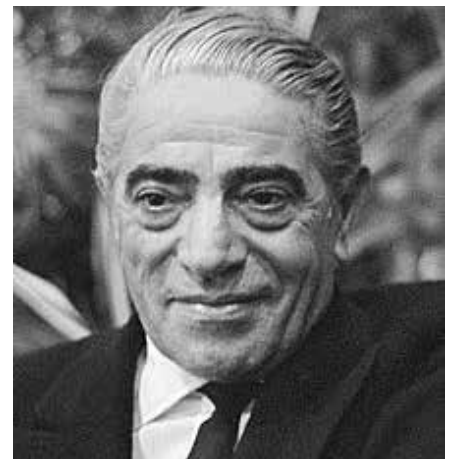
Aristotle Onassis.

Det var godt å komme hjem igjen. Vi er heldige som har mange gode minner.