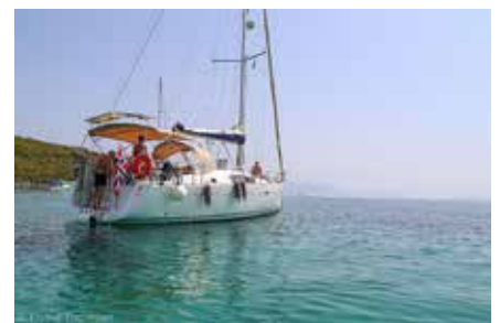
Nanna fra Ålesund med sitt mannskap