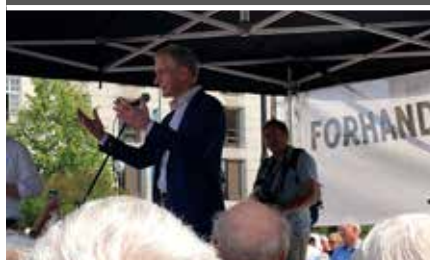
2 Jonas Gahr Støre