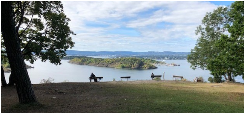
Bilde tatt utenfor kaféen

Vellet har i flere år, også sammen med andre lokale interesser, arbeidet for restaurering og gjenåpning av Kafe Utsikten, bl.a har vellet fremmet et alternativt kostnadsoverslag. Ifølge Nordstrand blad 30.05.23 anbefaler Bymiljøetaten at bygget rives. Saken er oversendt til byantikvaren for vurdering. Vellet vil følge opp saken.