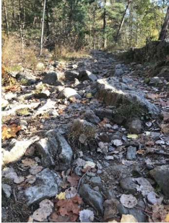
Parti av stien gjennom byskogen

Flere av våre medlemmer er opptatt av turstiene i området vårt, spesielt i byskogen, som ligger innenfor Ekebergskråningen naturreservat. Denne er i svært dårlig forfatning, på enkelte strekninger fremstår den som bare en sammenhengende steinrøys.