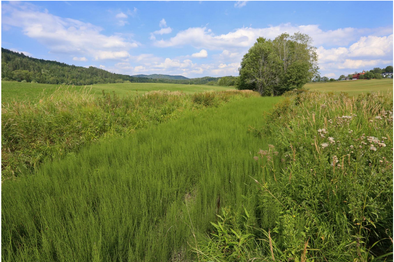
Øverlandselva var nesten gjengrodd sommeren 2018. Parti fra Øverlandsjordene, rett sør for golfbanen.