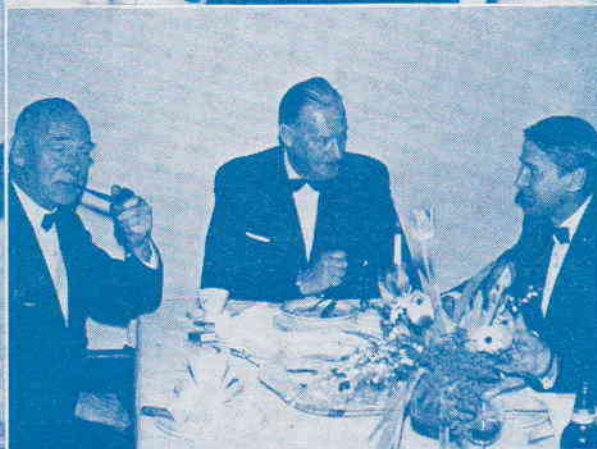
Glimt fra jubileumsmøtet i Drammen