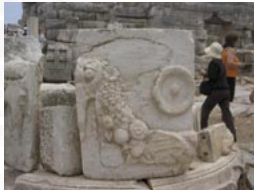
Ruiner i oldtidsbyen Efesos sommeren 2006

Om vi nå tar et skritt videre og tenker oss sirkelen som en spiralfjær sett ovenfra og deretter trekker ut spiralfjæren slik at spiralene ligger etter en annen, får vi en slags tredimensjonal sirkel med mange baner. Tenk videre at vår tid, vårt liv begynner sammen med spiralfjærens utgangspunkt og går i baner inntil vi når enden av spiralen, det punktet der tiden ikke lenger er målbar for oss i vårt liv her på jorden. Vi kan trekke spiralfjæren ut og skyve den sammen, men et punkt som er passert kan vi aldri gå tilbake til. Vi får aldri gjenoppleve et eneste øyeblikk. Solen står jo opp på et litt annet sted på horisonten hver eneste dag. Jordens bane rundt solen tar et litt annet leie hvert år. Hver dag er en ny dag, hver time en ny time.