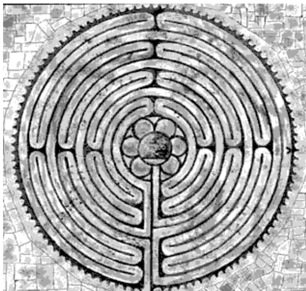
Labyrinten i katedralen i Chartres

seg oppover. I mystikkens verden er vi født som en liten prikk midt i sentrum, i begynnelsen av spiralen. Etter hvert som våre liv trer fram stiger vi opp gjennom flere nivåer på søken etter helheten, symbolisert ved de stadig større og større omgangene i spiralen. Vi er på let etter vår mystiske union med Det Absolutte. Mystikere har aldri blitt riktig enige om paradokset: Er Det Absolutte immanent eller transcendent? Er det vår søken utover i spiralen mot den transcendenten gud, eller er det en søken nedover spiralen mot vår skjulte bevissthet hvori vi kan finne guddommen?