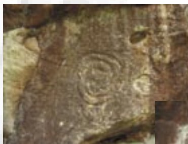
Helleristninger fra Roslin Glen nær Roslyn Chapel, Skottland.

En spiral, når den ikke er en todimensjonal sirkel, kan også bli til en rekke sammenhengende "nesten-sirkler", en rekke som egentlig kan fortsetter ut i evigheten, en serie "sirkler" som ikke returnerer til utgangspunktet. Det før nevnte evighetsperspektivet får nå en litt annen betydning, og blir til en Absolutt Evighet. Absolutt i motsetning til relativ. Absolutt i betydning det totale av både det kjente og det ukjente, det oppdagede og alt som ennå ikke er oppdaget. Implisitt betyr dette at vår oppfatning av Det Absolutte må være noe mer enn uendeligheten , det må inneholde "noe". I alle religiøse tradisjoner er det Gud som er over og utenom og inne i alt. Vi trenger bare å tenke på da "El(hoim)" sa til Moses: «Jeg er den jeg er...» (2. Mosebok 3,14).