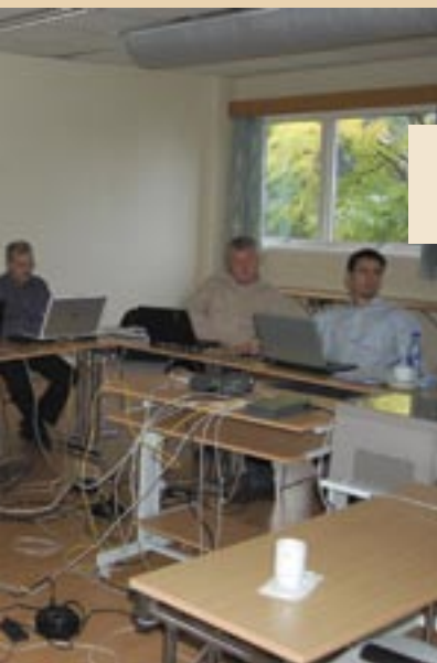
IT-gruppa i arbeid

Ordenssamfunnet, ikke bare til å utøve autoritet overfor deres Brødre.