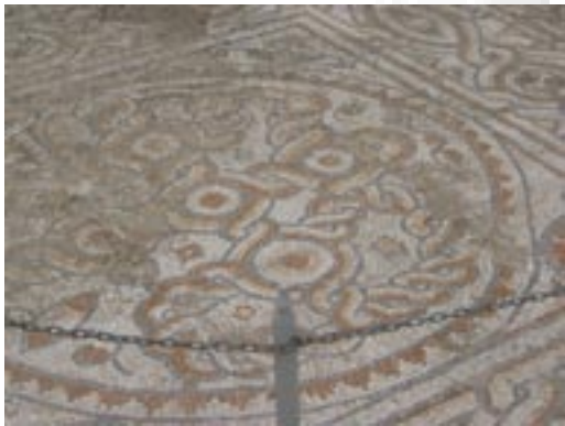
Fortau i Marmorveien fra oldtidsbyen Efesos

La oss betrakte sirkelen som bilde på noe vi kan fatte: Solens bevegelse over himmelen når den står opp i øst og går ned i vest. Hver dag. Dag etter dag etter dag. Vi kan dermed bruke sirkelen som en tidsmåler. Vi velger det øyeblikket solen står opp om morgenen og kan følge sirkelen til et