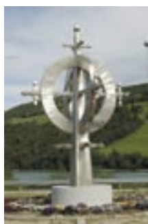
Forsidebilde: Dette "monumentet" er en kopi av spiret i Vågå kirke som står i rundkjøringen. på riksvei 15 i Vågå.