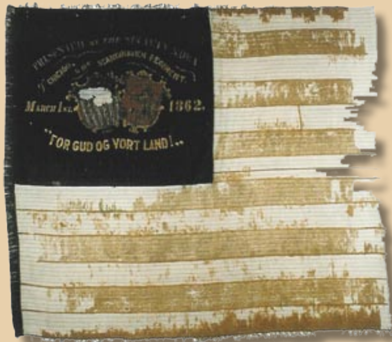
Flagget som ble gitt til regimentet har denne teksten.:Presented by the society NORA Chicago to the Scandinavian regiment March 1st 1862 "FOR GUD OG VORT LAND!"