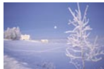
For- og baksidebilde: ©Aage Paulsen