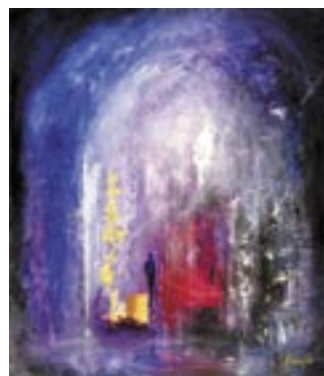
Forsidebilde (utsnitt) "Der veiene møtes" og side 19 "Adgang"

© Billedkunstner Tor Olav Foss, 2320 Furnes