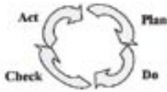
Demings PDCA sløyfe

Kvalitetssløyfen er anvendelig på alle slags aktiviteter og delaktiviteter. Sløyfens stepp følges i en bestemt rekkefølge. Plan (planlegge), Do (utføre), Check (verifisere), Act (korrigere).