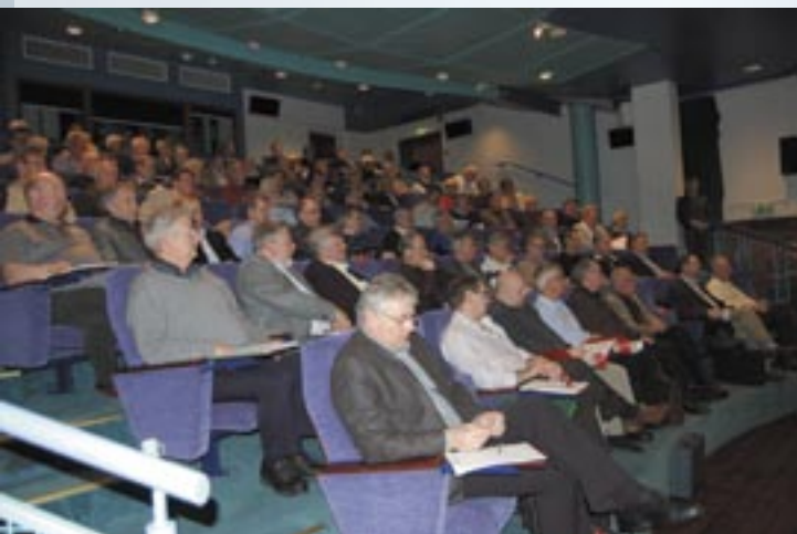
Fra arbeidsmøtet