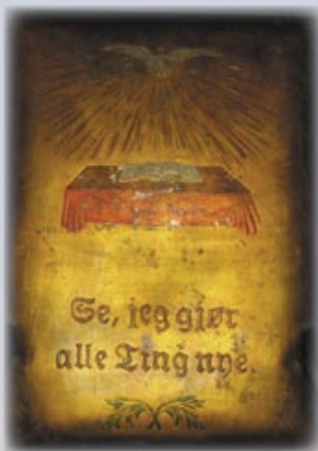
Detalj fra bispestolen i Tjølling kirke