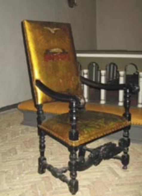
Bispestolen i Tjølling kirke