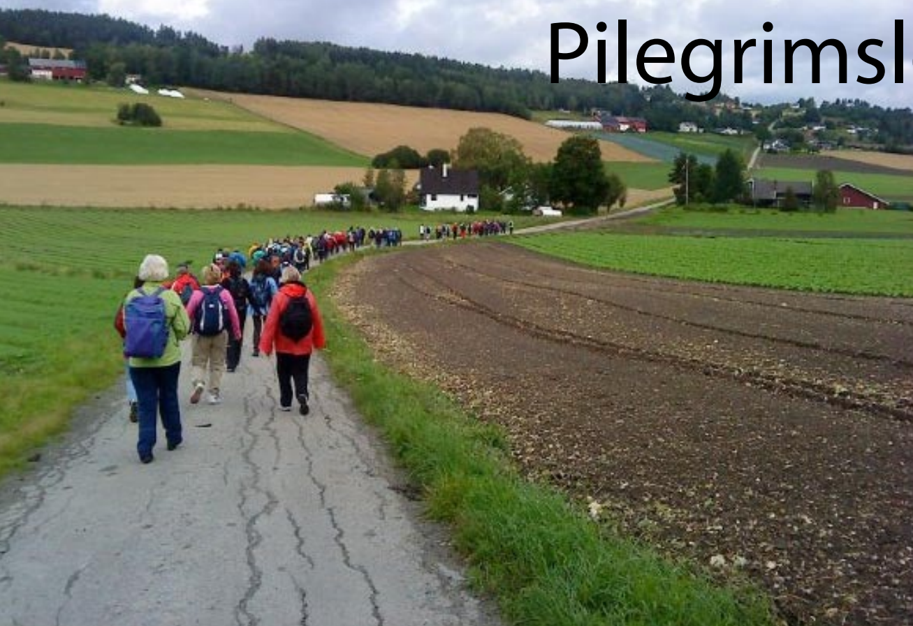
Pilegrimsleden fra Bønsnes kirke