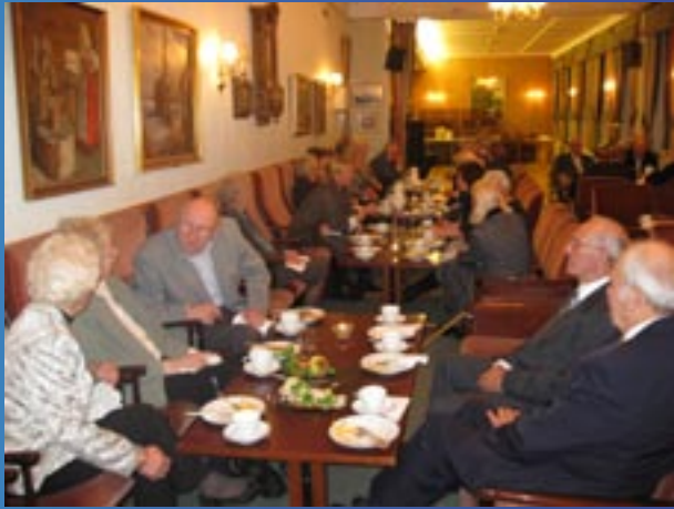
Kaffe og snitter - alltid populært