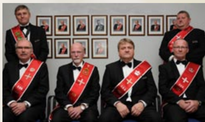
Sittende fra venstre: Drott Losje III, Riksdrott, Drott Losje I og Drott Losje XIII. Stående fra venstre: Hærmester Provinsiallosje Viken og Drott Losje II

Det neste fellesmøtet i 2011 avholdes hos Losje XIII på Hønefoss. Det falt derfor naturlig at Drott Losje XIII takket for maten.