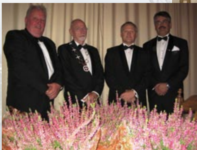
Til v: Drott Losje XXI Voss, Riksdrott, Drott Losje XX, Haugesund og Drott Losje XII Bergen