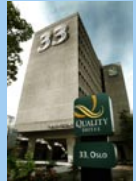
Det 57. Ordentlige Riksting avholdes her, se side 4