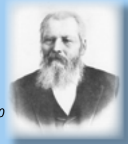
"Enighed er Broderaand" se side 10