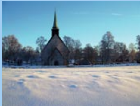
For og baksiden: Stiklestad kirke i vinterskrud