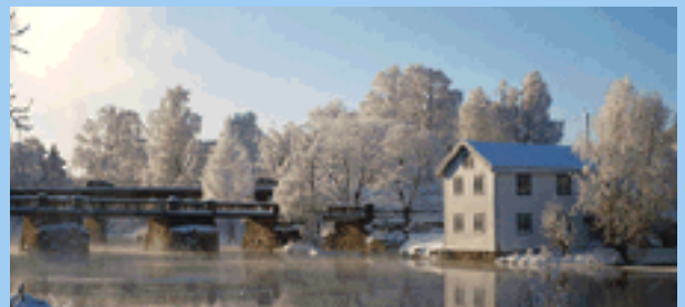
Losje XXVI Eidsvoll har flyttet til nye lokaler, se side 6