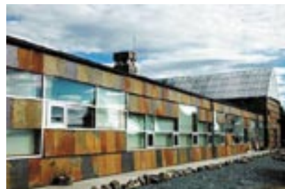
Sancta Maria de Tuta insula

I nærheten av dette ble det i 2006 ferdigstilt et nytt kloster også tilhørende cistercienserordenen; Tautra Mariakloster eller Sancta Maria de Tuta insula . Her stopper vi og deltar på middagsbønnen (Sekst). Besøkssentret blir åpnet der vi kan få handle i klosterbutikken samt se en film om klosteret. Klosteret ble for øvrig kåret til årets bygg i 2006 av byggebransjen i Norge. Etter dette kjører vi til Valberg slektsgård hvor vi får servert lunch, før turen går tilbake til Levanger.