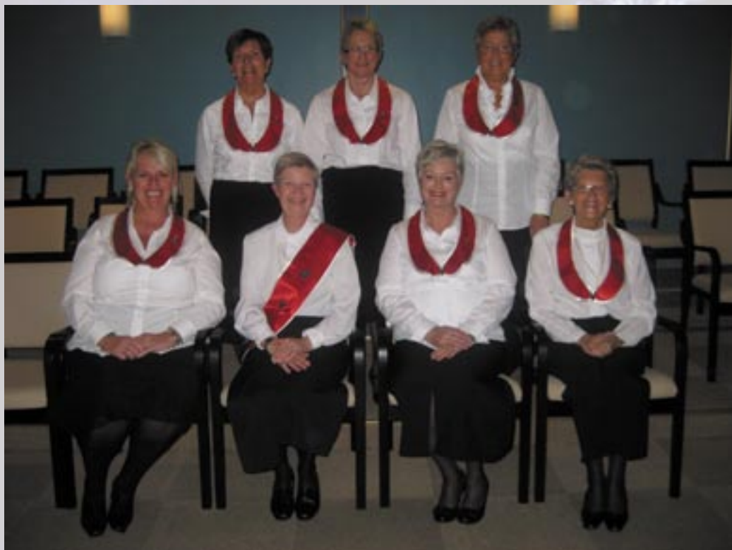
Rådet i Bergen