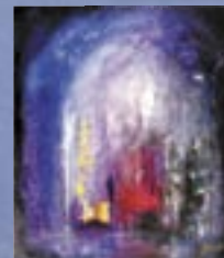
Side 31 "Adgang" © Billedkunstner Tor Olav Foss, 2320 Furnes