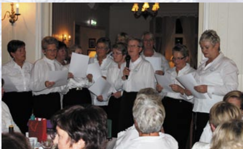
St. Olavposten 4-2011