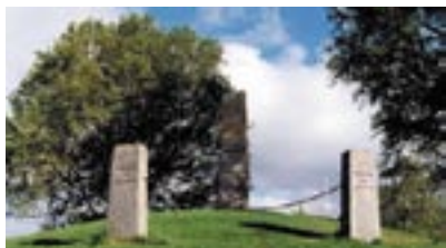
Tinghaugen på Frosta