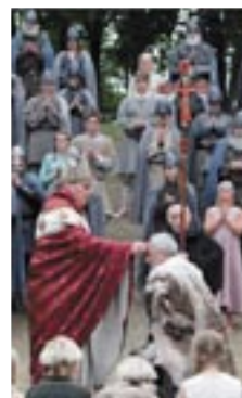
Fra spelet om Heilag Olav