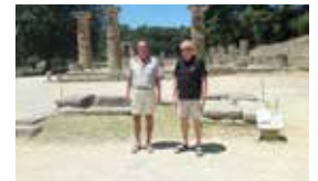
Losje XIII på tur til Hellas - side 20