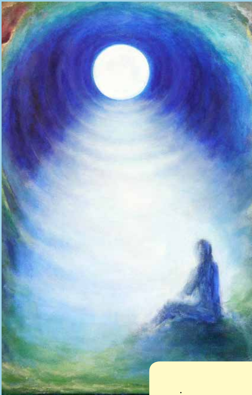
Bildet av maleriet Resonans er gjengitt med tillatelse av kunstneren, Broder Erik Audun Utistog, Losje XIII Hønefoss.