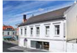
Losje VII Moss flytter inn i eget hus - side 4