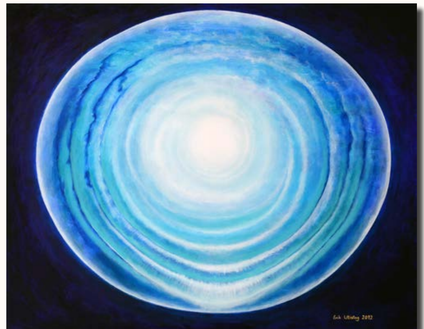
'Ripples of Love'