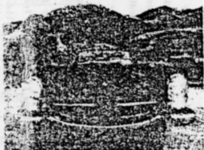
World's largest selection of automotive literature

BESTILL KATALOGEN NÅ! FRAKTFRITT TILSENDT MOT KR. 20,-. SEND 20 KR. PR. POSTANVISNING ELLER POSTGIRO ( 4 00 92 39) og skriv på talongen hva beløpet gjelder. Du kan også sende beløpet pr. frimerker el. likn. i vanlig konvolutt.