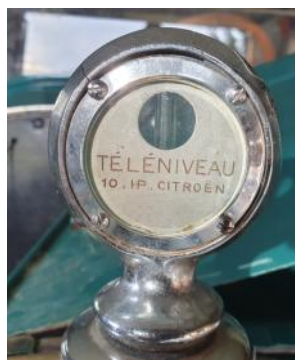
På temperaturmåleren står det at bilen har 10 såkalte skatte-hk