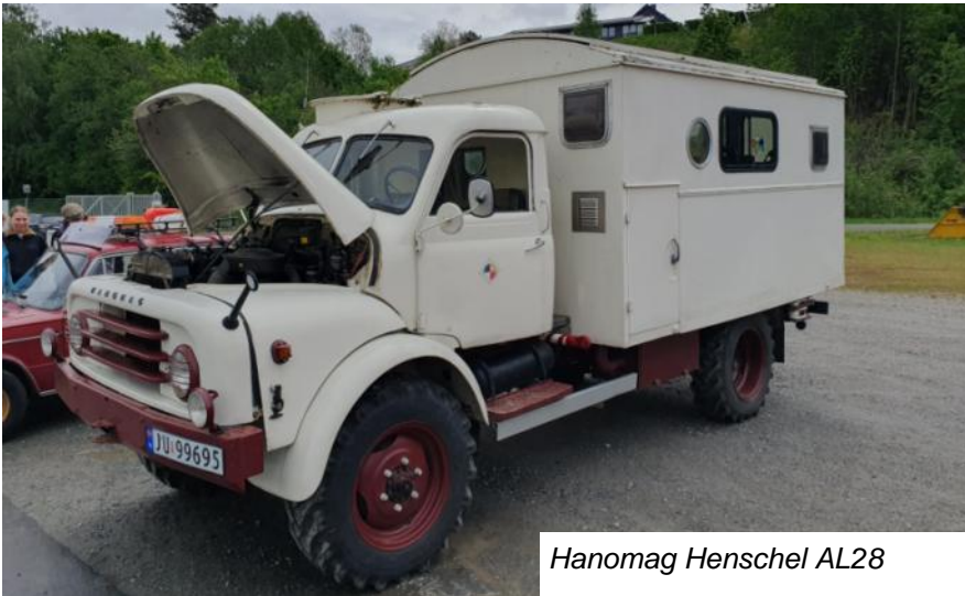
Hanomag Henschel AL28