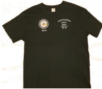
T-skjorte jubileum 100,-