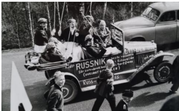
Citroën russebil ca 1959