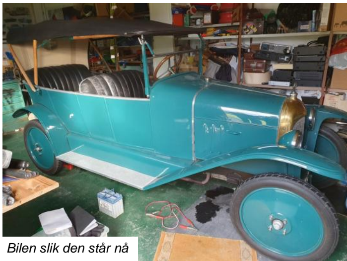
Bilen slik den står nå