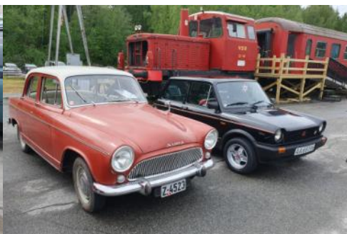
MKROs 1962 Simca ved siden av en Autobianchi