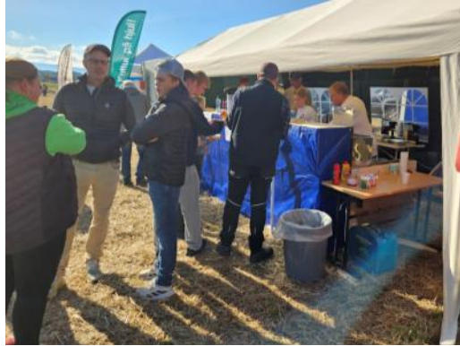
Det var en travel dag i kiosken

Lørdag 27 . september ble NM i veterantraktorpløying arrangert på Nordre Sørum gård i Hole. Mesterskapet ble arrangert av Gammeltraktorens venner i samarbeid med MKRO. Det ble konkurrert i tre klasser: Traktor med slepeplog, traktor med løfteplog og tohjulstraktor. Den eldste traktoren som deltok var en Fordson fra 1920-årene med jernhjul. Arrangementet var på historisk grunn, for 60 år siden arrangerte Norges bygdeungdomslag VM i traktorpløying på samme sted.