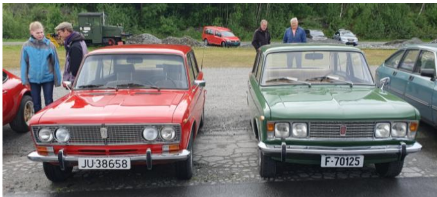
1978 Lada 1500 og 1970 Fiat 125 B. Lada var basert på Fiat 124 fra 1966, så slektskapet er tydelig.