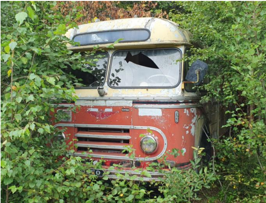
En Volvo-buss i buskene

Motorhistorisk klubb Ringerike og omegn Postboks 1019 3503 Hønefoss