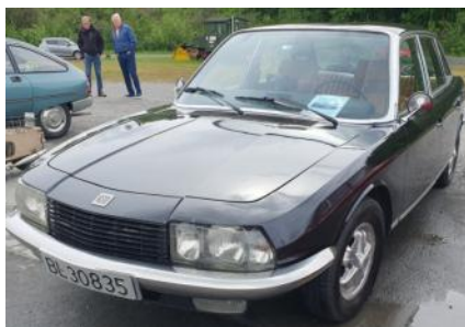
NSU Ro80 1969 modell med Wankelmotor