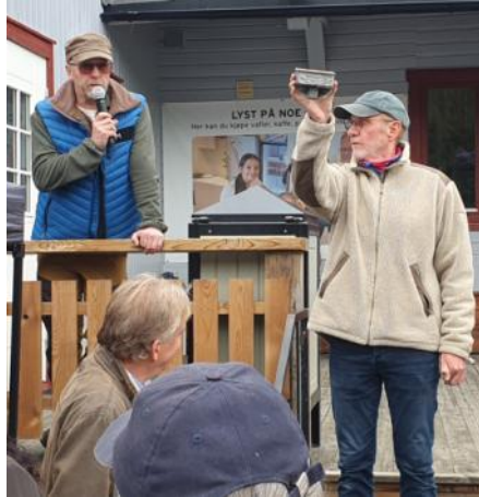
Noen bud på NSB-askebeget?

Lørdag 20 september ble årets marked arrangert. 18 selgere hadde rigget opp salgsboder. Det var en del færre enn i fjor, noe som kan skyldes at det foregikk flere andre markeder på Østlandet samme dag. En nokså middels værmelding kan også ha dempet interessen, men vi slapp unna med noen få regndråper ut på ettermiddagen. Publikum strømmet til utover formiddagen, og omsetningen i kafeen var svært god. Bil- og motorsykkeldeler, sykkeldeleler, verktøy, klær, samleobjekter, kopper og kar var noe av det som ble tilbudt på markedet.