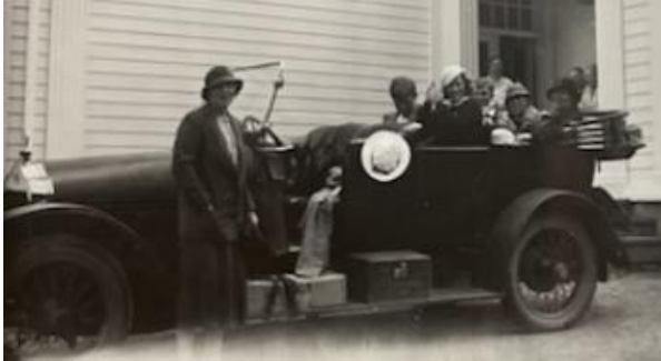
Klar for søndagstur.

Grøndahl bodde i disponentboligen på Folum som lå der PM 7 senere ble bygget. Disponentboligen hadde garasje, og det hadde også den herskapelege boligen på Rundtom som familien etter hvert flyttet til.