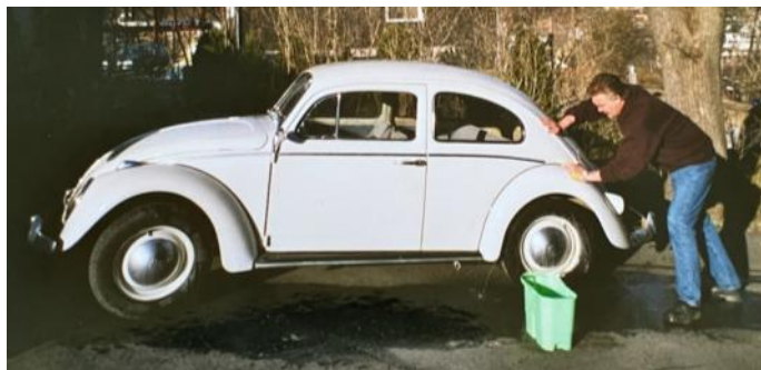
Bilvask i 2004