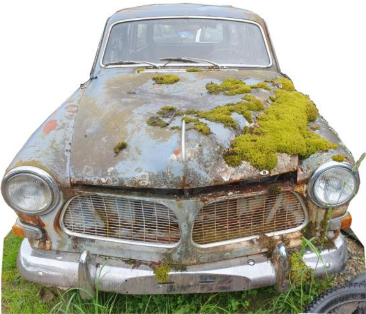
Volvo Amazon herregårdsvogn etter mange år i skogkanten.

Motorhistorisk klubb Ringerike og omegn Postboks 1019 3503 Hønefoss