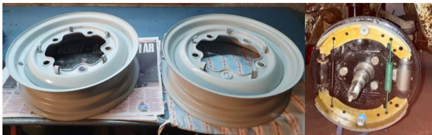
Nylakkerte felger, nye bremses og "ny motor

og forgasser og fordeler er av en annen type enn det som satt på bilmotorer. Ellers er motorene like, og av samme årsmodell.