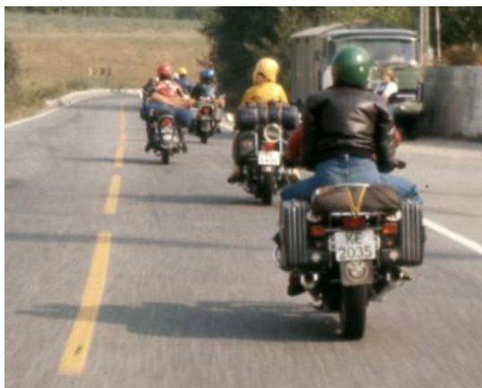
Ringerike MC-klubb på tur en gang på 1970-tallet.

formasjon, såkalt kolonnekjøring. Det vil si at motorsyklis-tene ligger annen-hver mc litt til høyre og litt til venstre i kjørefeltet. Dette gir bedre sikt både for-over og i speilet bak-over. Det blir også vanskeligere for biler å bryte inn i kolonnen og dermed slipper man unødvendige forbikjøringer.