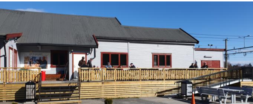
Mange nyter solen på den nye verandaen første lørdagen i april