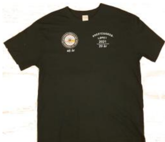
T-skjorte jubileum 100,-