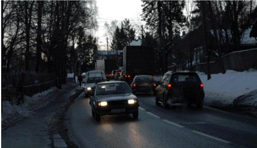
Griniveien mot Røa-krysset en vanlig vinterdag 2005-2006

Røa Vel vil i tiden frem til mai arbeide med politiske myndigheter for å sikre at tidligere politiske vedtak blir gjennomført, og at grunnlaget for bymessig fortetting av Røa blir oppfylt.